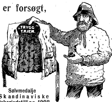
Sølvmedalje Skandinaviske Fiskeriudstilling 1908