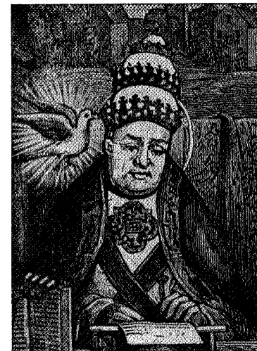
Pave Gregor den Store.

Foruten sin store virksomhet i Italia-og-Sicilien kjempet Gregor