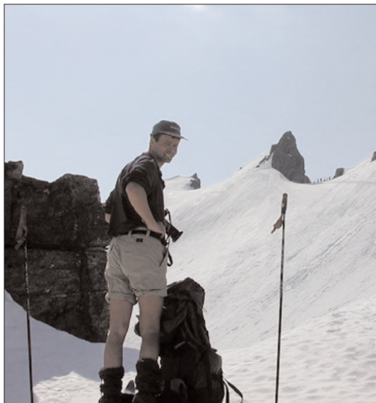
Størker slik vi gjerne husker ham, på vei mot toppen og med kameraet skuddklart. Dette bildet er fra TTF-turen til Sunnmørsalpene i april/mai 2000, her på vei til Nordre Særetind.