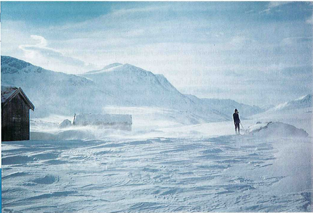
Snøfokk mot Svarthetta.