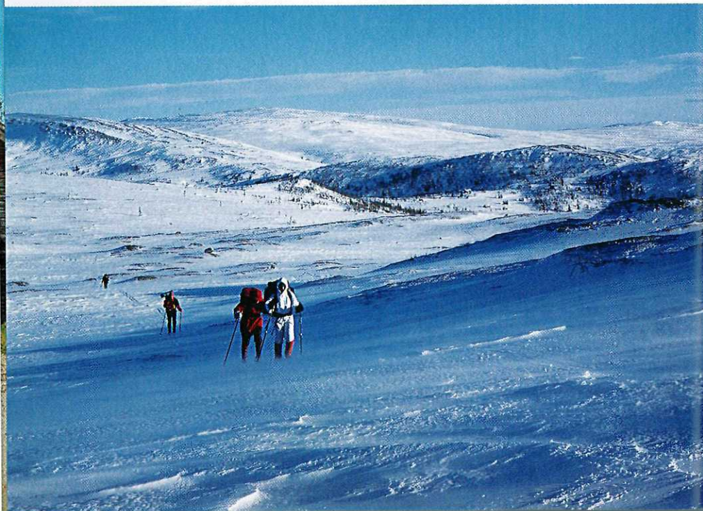
Stri vind framover mot Selbu fra Schulzhytta.