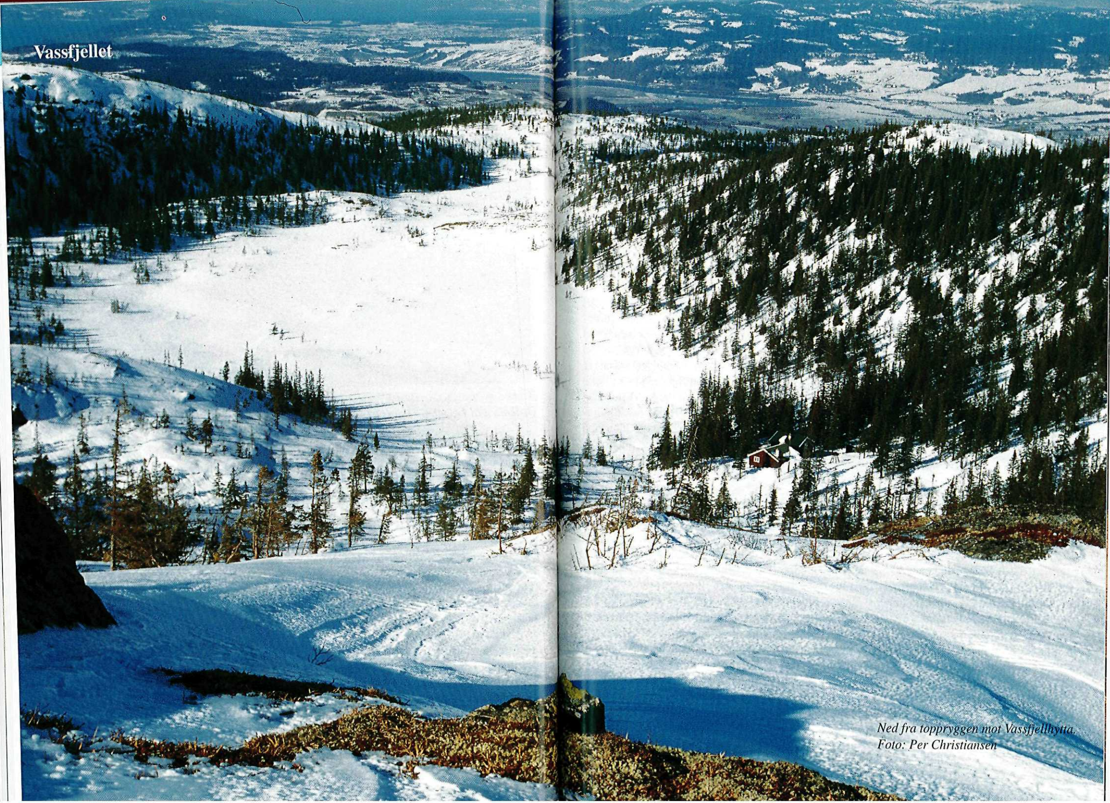
Ned fra toppryggen mot Vassfjellhytta.