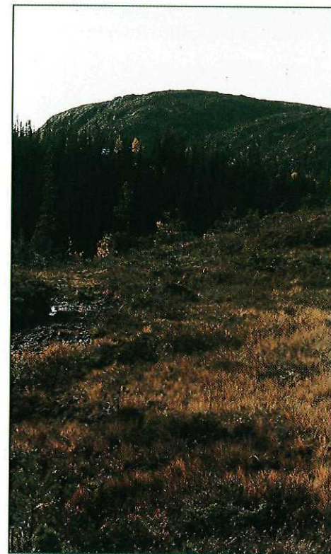
En høstdag med glassklar sikt egner seg godt til en tur over Vassfjellet, som rister den gullfargede lauvskogen av seg før det skyter rygg og leiker høyfjell.

Gode bein, men vel neppe noe mirakel, trenger også vi når vi tar fatt på oppstigninga til toppen (710 m). Rett opp for Vassfjellhytta, gjennom den glisne granskogen, er det brattest, men man får litt slakere terreng om man går i en bue til høyre og opp på toppens skulderparti, der bomveien fra Kvål også kommer opp. Fra toppen er det imidlertid lett terreng langsetter den knudrete Vassfjellryggen nordvestover, delvis i knasende reinlav. På Tortberga ytterst på fjellet tar vi ned en liten dal til venstre, der det står tett med vindblåst smågran. Videre langs tydelig bekkefar og ned på veltråkket sti på skrå til høyre i bratta. Nedenfor er stien lett å følge over Reinslettalsåsen (495 m), Higeråsen (450 m), forbi Damtjønna (347 m) til Vassfjellkapellet (bygd av kristenstudenter på 1970-tallet) og skogsveien ned i Skjøla derfra.