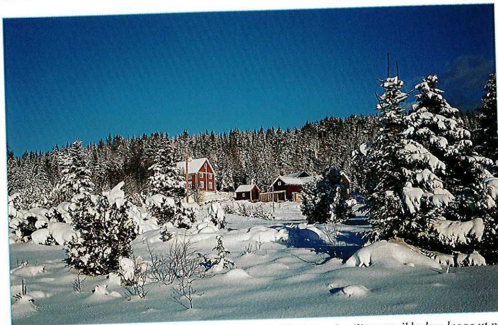
Lavollen er igjen blitt et populært turmål, ikke minst for barnefamilier som ikke kan legge ut på de riktig lange turene.

Hjemturen starter gjerne med skiene på skuldrene opp til Lille Gråkallen (455 m). Vi svinger sør om militærleiren langs gjerdet før vi begynner på øverste del av Rustadrenna mot øst. I dypsnø må vi gå noen skritt på de flateste partiene her, da bruker vi gjerne litt tid på å beundre utsikten mot byen og Geitfjellet før vi fortsetter nedover. Rustadrenna prepareres nå jevnlig og ved skarpt føre kan vi få den helt store "Kitzbühel-følelsen" nedover den øverste bratte bakken. Alpinklubbene i Trondheim arrangerte utforrenn ned Rustadrenna på begynnelsen av 80-tallet. Vær oppmerksom på at i helgene hender det at festdeltagere fra Studenthytta ødelegger denne bakken med spretthopp-renn og akekonkurranser.