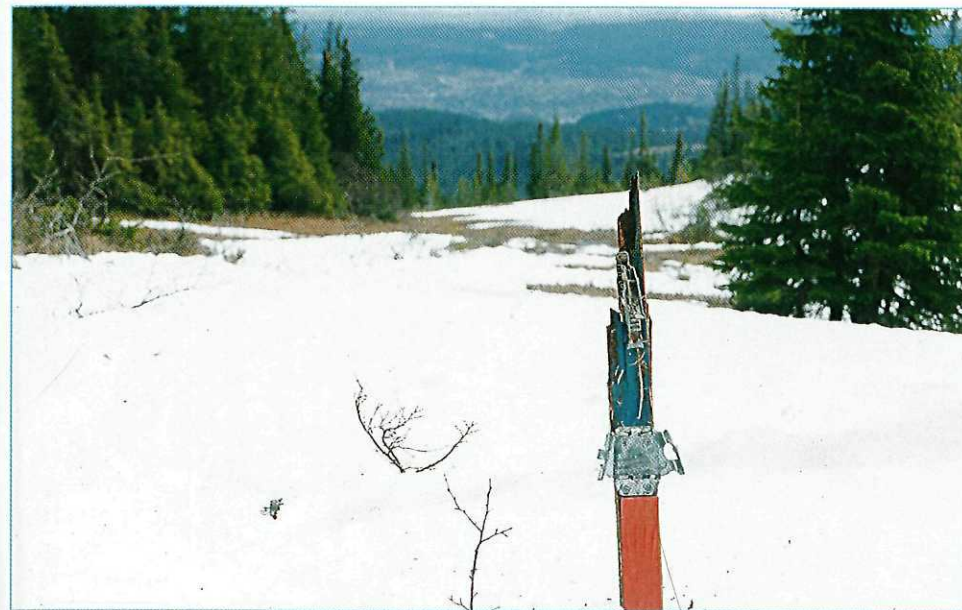
Brukne ski langsetter Rustadrenna vitner om mang en «bjønn» i denne utførløypa fra Lille Gråkallen til Lavollen.

Dersom vi er heldige med forholdene, fortsetter vi i stor fart ned over kuler og svinger, vi krysser stien (veien) fra Fjellseter mot Kobberdammen (tidlig på vinteren kan grøftene her stille store krav til skiferdighetene) og fortsetter bortover Rustadrennas største flate (330 m). Ved trått føre og i dypsnø ser vi oss gjerne litt om etter storfugl og orrfugl herfra og nedover. Ved skarpt føre mister vi nesten ikke noe fart på flata og fortsetter over kuler