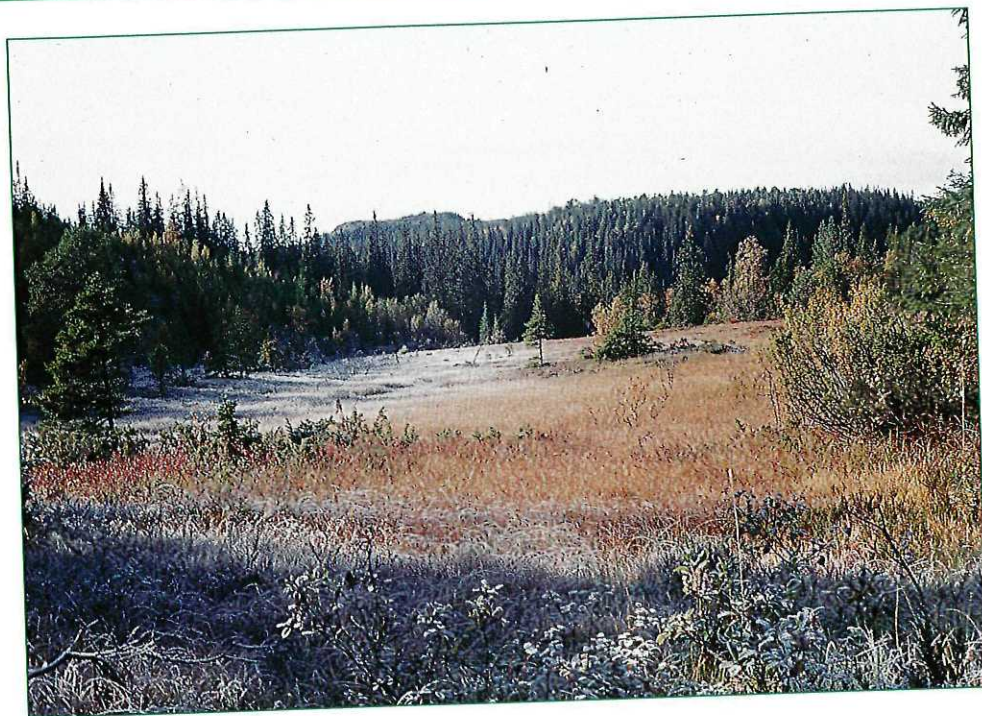
Sørvestover Klefstadmyra.

Ned fra toppen er det mange vegvalg på fine stier. Vi forlater det freda buskfuruområdet, og møter storskogen ovenfor Helkansetra med speiderhytta. Videre går turen ned til Baklidammen og langs Familiestien til utgangspunktet.