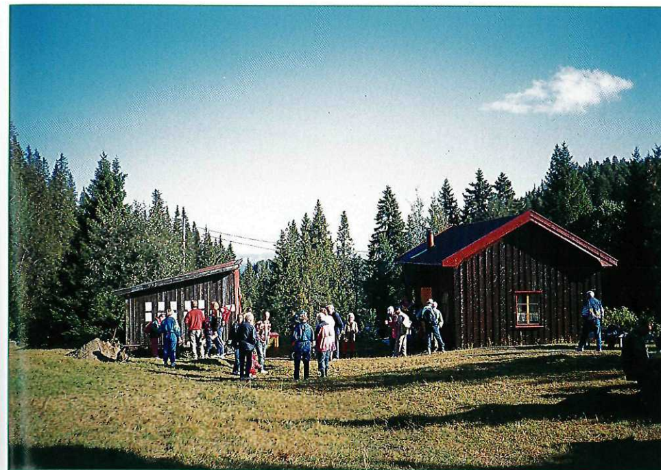
Fra Damhaugen, der det kan være mulig å få servering på turen.

Vi kommer inn på Driftsvegen som ble anlagt i mellomkrigstida som nødsarbeid. Den krysser Garnisonsmyra i et område med mange våpenstillinger fra siste krig på bergknausene ut mot fjorden. Ved Tyandalsdammen slår vi inn på en idyllisk sti over furukollene som er nokså karakteristisk for denne delen av marka. Stien ender ved Trollykkja, en åpen voll