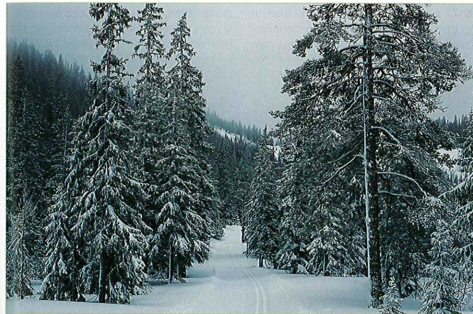
Det er ikke bare i Bymarka det er godt med snø og fine løyper...

Kastbrekkåsen har vært foreslått som utbyggsområde for boliger.