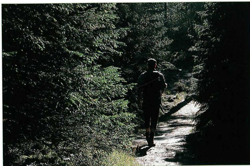
På trivelige smådimensjonerte skogsstier.

Kastbrekkåsen det eneste større bevarte vi har igjen av denne typen områder sentralt i Trondheim.