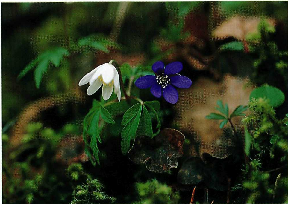
Det finnes mer eksotiske planter enn blåveis og hvitveis på Lade, men kanskje ingen mer kjærkomne...