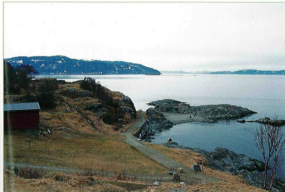
Etter stien rundt Ladehammeren er man i Korsvika med ett et godt stykke vekk fra byen.

Området mellom Kjerringberget og Østmarkneset har en rekke minner fra 2. verdenskrig. Stillinger for luftvernkanoner og maskingevær, foruten ammunisjonslagre preger området, men her finnes