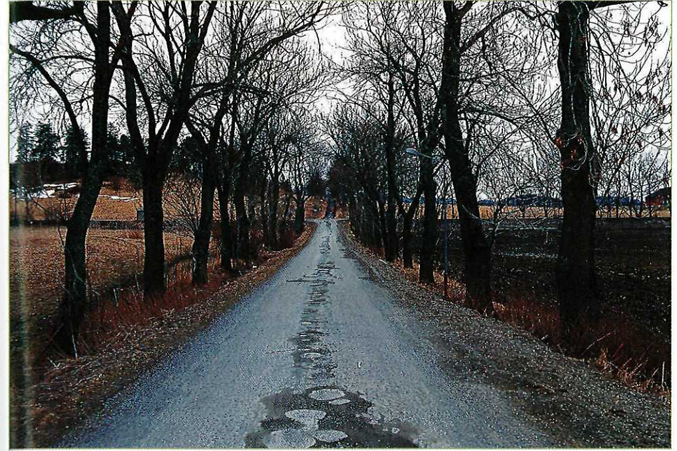
Askealleen ved Rotvoll nedre.

Fra Fagerheimsbukta følger vi Meinckestien til Devlebukta. Stien er oppkalt etter familien som i mange år eide Devle gård. Videre kommer vi til Leangenbukta. Leangen gård, reist av familien Must, er i dag representasjonsbolig for kommunen. Dessuten ligger kommunens gartneri her.