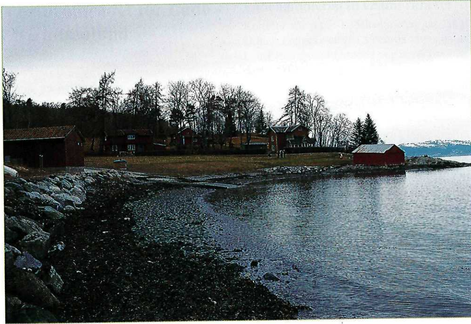
Fra Ringvebukta, mot Adrianstua og Strandheim.

plasser som lå under Lade gård. I Østmarkbukta er det ei fin rullesteinstrand. Mellom Østmarkbukta og Ringvebukta er det flere bratte bakker. Her er det mulig å ta en avstikker fra stien over mot Østmarka og Ringve Museum. Rett øst for Østmarkbukta ligger en bunkers i det bratte terrenget. Den er lett å finne på grunn av en stor steintipp ned mot sjøen. Tunnelen her går omtrent 100 m inn i fjellet og regnes som "sikker", slik at det er anledning til å gå inn. Men god lommelykt må til.