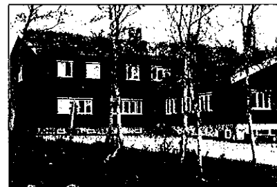
Nedalshytta ligger i bjørkeskogen ovenfor Nesjøen.

Adkomst fra Stugudalen i Tydalen, veg helt inn (ikke vinterbrøytet), parkering ved hytta. Vinters tid grei skitur inn fra Stugudalen, ca. 15 km, vinterstaket.