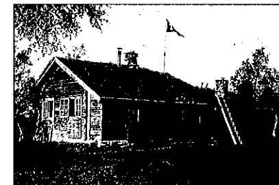
Den gamle Nedalshytta måtte vike for oppdemningen av Nesjøen og ble revet i 1971.