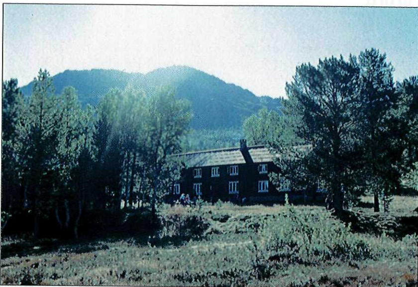
Noen TT-hytter er betjent i påska og i sommersesongen. Trollheimshytta, som ligger lunt til i skogen der Svartådalen møter Folldalen, er ei av dem.