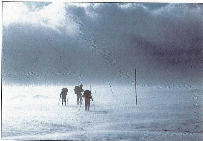
I Sylene er de viktigste vinterrutene permanent staket.

påske og 10.000 i sommersesong. Vel 5000 overnattinger var på selvbetjente hytter/kvarterer. I tillegg kommer 1500 overnattinger på utleide betjente hytter utenom sesong.