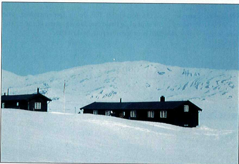
De fleste av TT-hyttene er selvbetjente. Til Ramsjøhytta f.eks. må fjellvandrerne ta med seg lånt nøkkel.