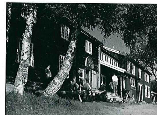
Gjevilvasshytta før og etter den siste ombyggingen (1991 og 1994)