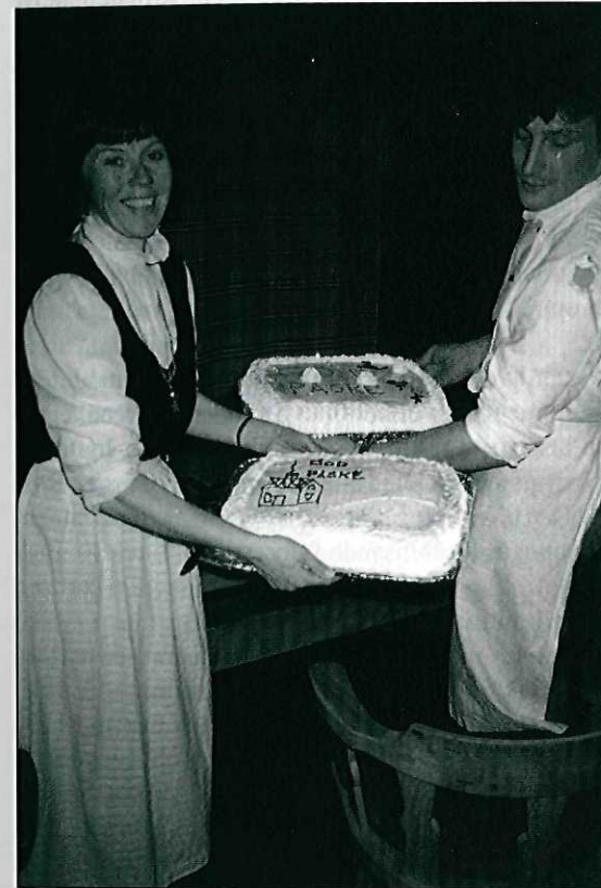
På påskeaften hører bløtkake med til pliktene.

Middagen er viktig for hytteturistene, ingen tvil om det. Etter en lang og kanskje slitsom dagsmarsj gir det en god følelse å sette seg til et dekket midagsbord. For oss på hyttene blir det viktig å gjøre denne opplevelsen så god som mulig. God mat, nok mat, varm mat og næringsrik mat. Det er lett å