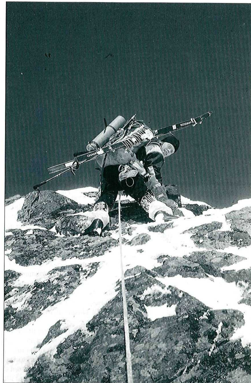
Opp topphammeren på Storsylen.

Men det er februar, dagen er på hell, restene av dagslyset må benyttes godt. Det krever litt forsiktighet, men det går greit ned fra toppen. Vel nede snur vi oss og synes at Syltoppen er imponerende herfra også. Opp over eggen til Lillesylen og videre siste del av eggen går greit unna. Men nå merker vi skikkelig at vinden har øket på. Den er så sterk at vi må bite oss fast i fjellet for ikke å bli feiet overende. Men snart kan vi spenne på oss skiene og er raskt fremme til traversens siste toppunkt. Og belønningen, det er nettopp lekne telemarkssvinger nedover den bratte fjellside - som seg hør og bør i en vakker solnedgang. Turen i mørket ut til Stugudal går vi i tilfredshet over det fjellet har gitt oss av nye opplevelser. En minnerik februarsøndag.