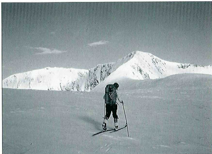
Langs Syleggen på ski.