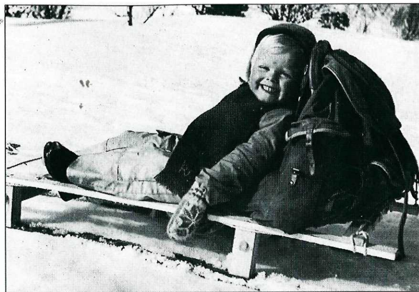
En glad påsketurist på skikjelke og med ryggsekk, skal vi tippe anno 1956?