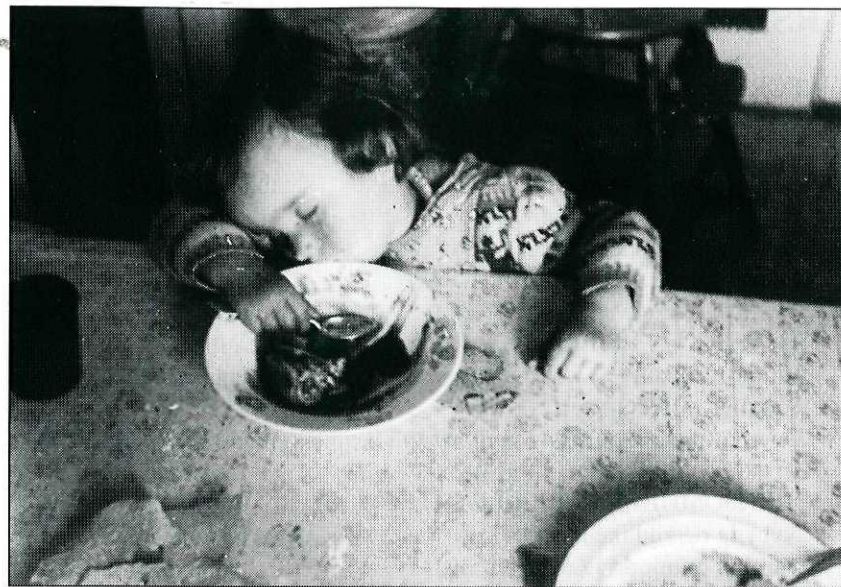
Mye var likeens før som nå i fjellet. Småfolk ble gjerne trøtte til kvelds den gangen også.