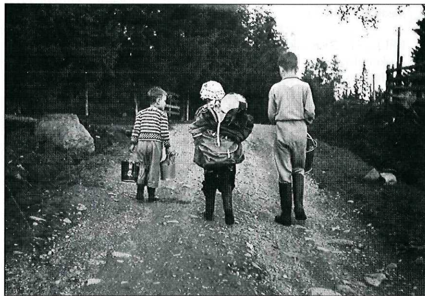
Til fjells med tung bør. Dette bildet kjenner kanskje noen igjen fra årboka for 1954?