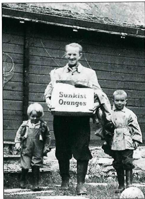
Et bilde fra Kåsa der TT sørget for proviantering og trivsel både for store og små i mange år.