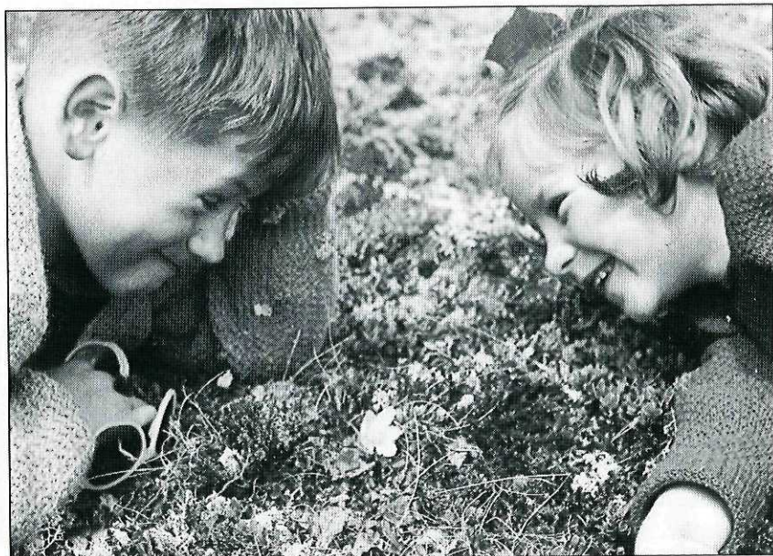
Fjellbotanisering med frisyre og kler som antyder 50-tall. Men hvem og hvor?