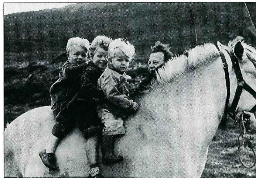
Tre glade gutter til hest.