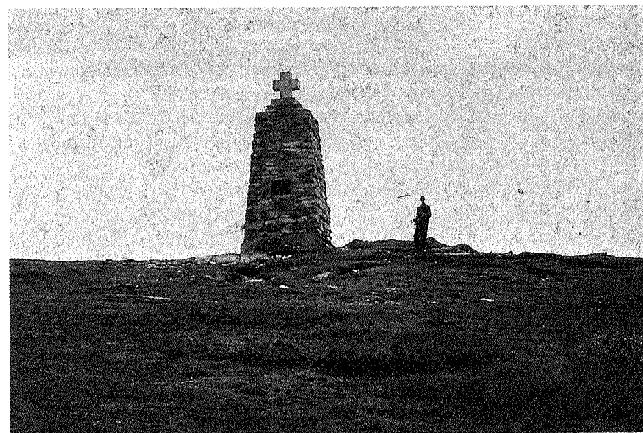
Minnesmerket på Bustvalen der Armfelts soldater gjennomgikk umenneskelige lidelser først på januar i året 1719.

Under oppstigningen fra dalen svartnet himmelen i nordvest. Vinden frisknet på, og snart drev snøbygene tett over den lange rekken med soldater. Leir for natta ble slått ved nordenden av Essandsjøen. Her fant soldatene lite å nære bålene sine med og måtte ty til både geværkolber og sleder i et desperat forsøk på å holde varmen i den kraftige snøstormen som nå herjet i fjellet. Alle bål sloknet lenge før daggry, og både oppbrudd og den videre marsjen skjedde i full uorden. Hele arméen var snart i oppløsning. Hver mann hadde nok med å berge seg sjøl. Mange segnet om av frost og utmattelse i løpet av dagen, og ingen hadde mulighet til å hjelpe dem opp igjen. Da mørket senket seg denne dagen, den 1. januar 1719, ble leir slått ved Bustvola like ved grensen. Brensel fantes det heller ikke her, og de sparsomme matrasjonene var også på det nærmeste tatt slutt. Kulda og stormen tok hundrevis av liv denne natta, utslettet så å si en finsk avdeling som fra før hadde vært igjennom mange vintertokt. Men på dette felttoget stilte svært dårlig rustet. De fleste hadde uniformsplaggene rett på kroppen, uten noe varmende undertøy.