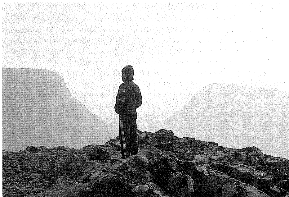
Gjennom Ekorndörren gikk pilegrimstrafikken til og fra Trondheim i flere hundre år.

De fleste som passerte gjennom disse fjellovergangene var nok jämtar. Slik kan vi snakke om en dominerende vestlig trafikk, sjøl om folk naturligvis etter endt ærend i Trøndelag siden gikk samme lange og harde vei tilbake. I mange hundre år sto jämtene i en mellomstilling i forholdet til Norge og Sverige. To