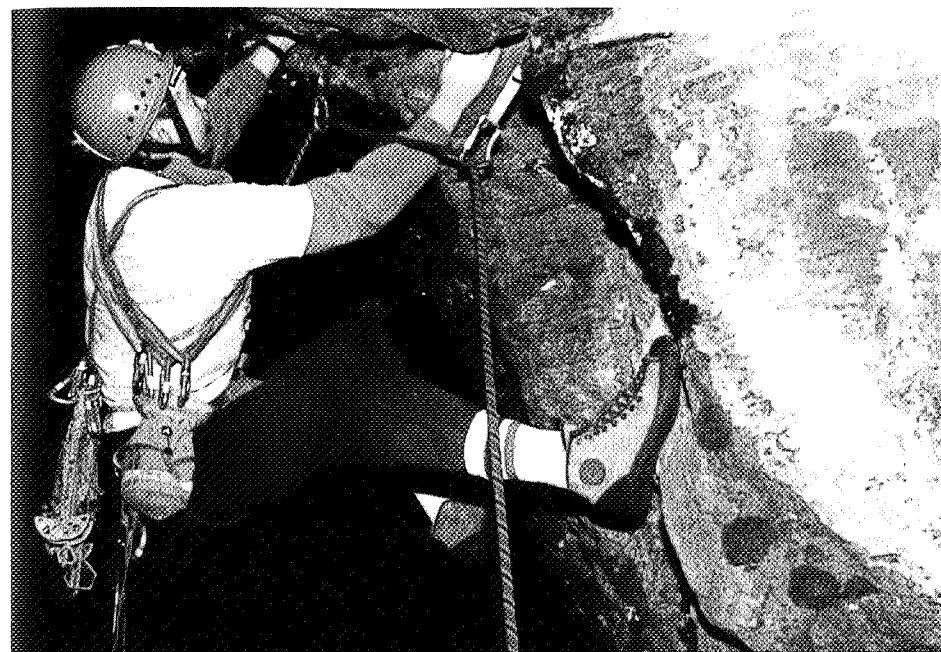
Bratt og tung klatring i svart høstkveld.