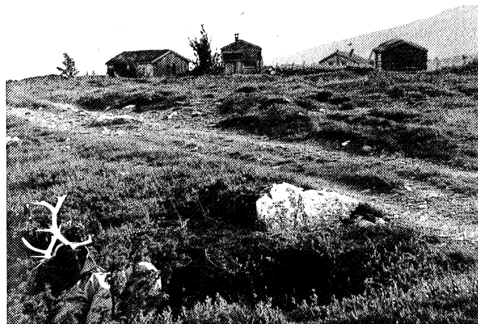
Fangstgrop ved Grindalsetra, et vitne om bruk av fjellet i gammel tid.

I høyfjellet er fangstgravene imidlertid de vanligste, bl.a. vestover fra Tovatna og innover mot Sunndalsfjella. Fangstgravene er murte, rektangelformede fordypninger med steinsatte gjerder i ruseform for å lede reinen i fella. På Grinaren finnes et interessant anlegg av denne typen.