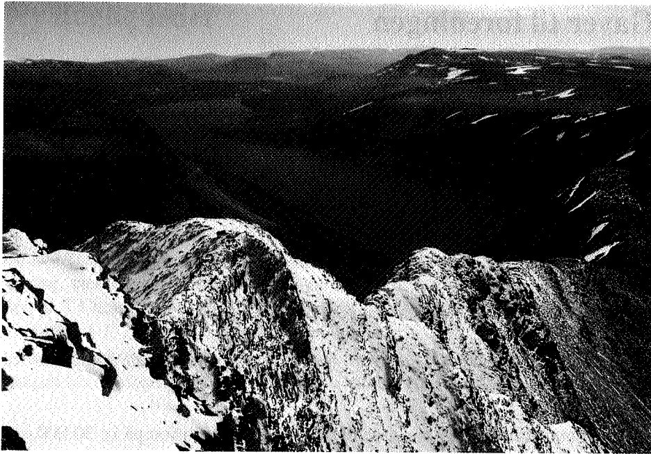
Midtre Gjevilvasskam med Gjevilvatnet.