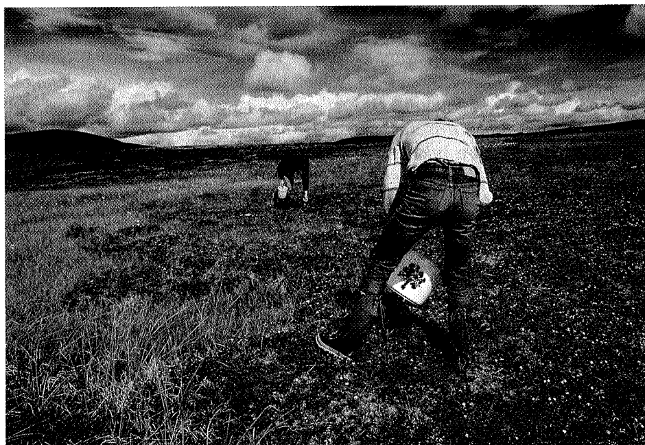
Bærplukkerne - turlivets antihelter?