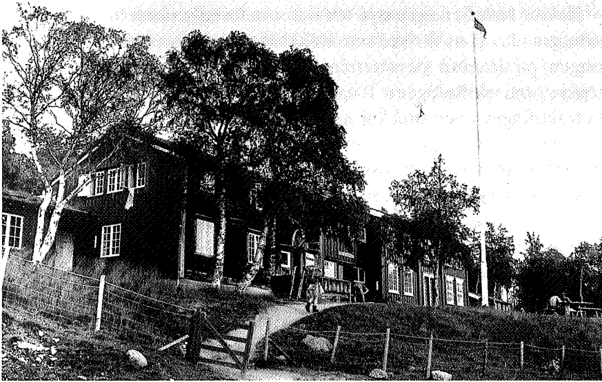
Gjevilvasshytta i dag. Sliperstua er den venstre delen av det tredelte hytteanlegget. ERIK STABELL

Den 12 oprandt straalende med sol som gull over alle fjeld. Allerede i 9 tiden om morgenen hörtes Jentelatter frem i skogen. Hr. Grilstad besøkte os den dag. Hans følge bestod av 3 damer. De var paa vei til Jöldalshytten. Alle uttaler sin glede over at arbeidet med hytten er saa langt fremskreden.