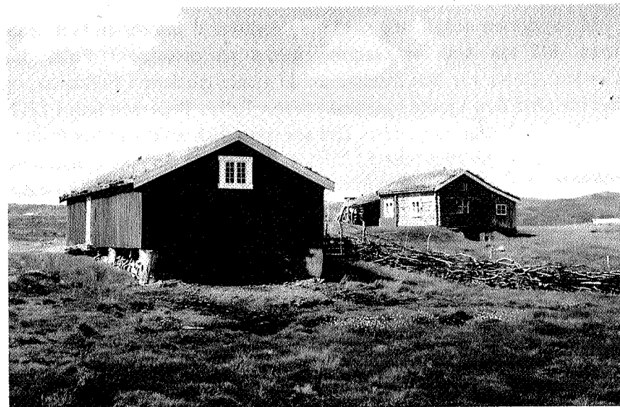
Rishaugsetra ligger mellom Nerskogen og Jøldalshytta. Her bærer bygningene preg av godt vedlikehold og fortsatt bruk.

Her møttes den gamle setervegen fra Rindalen over Glupen og