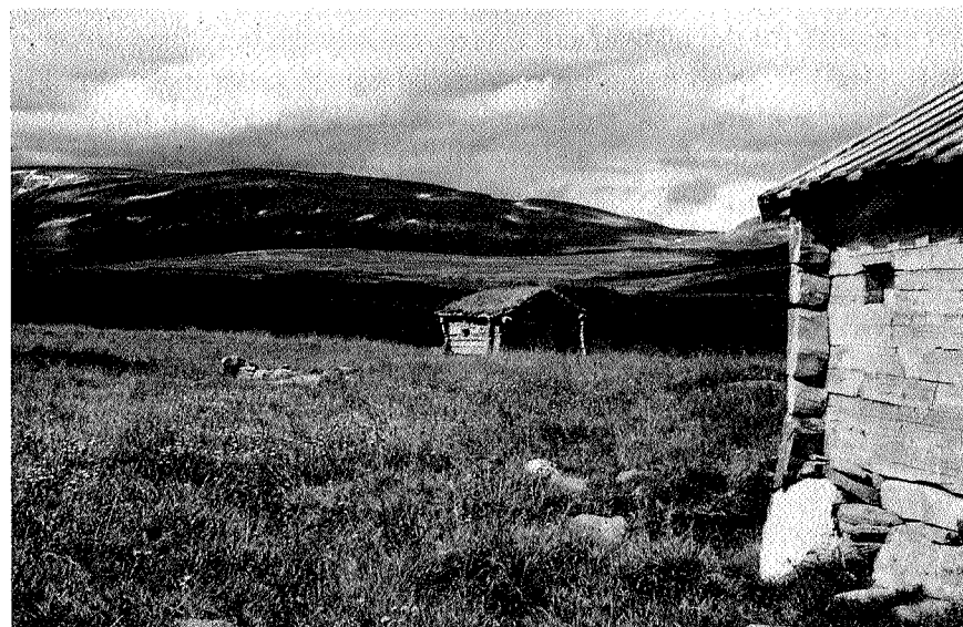
Setervollene i Trollheimen vitner om en utstrakt bruk av ressursene i fjellet.