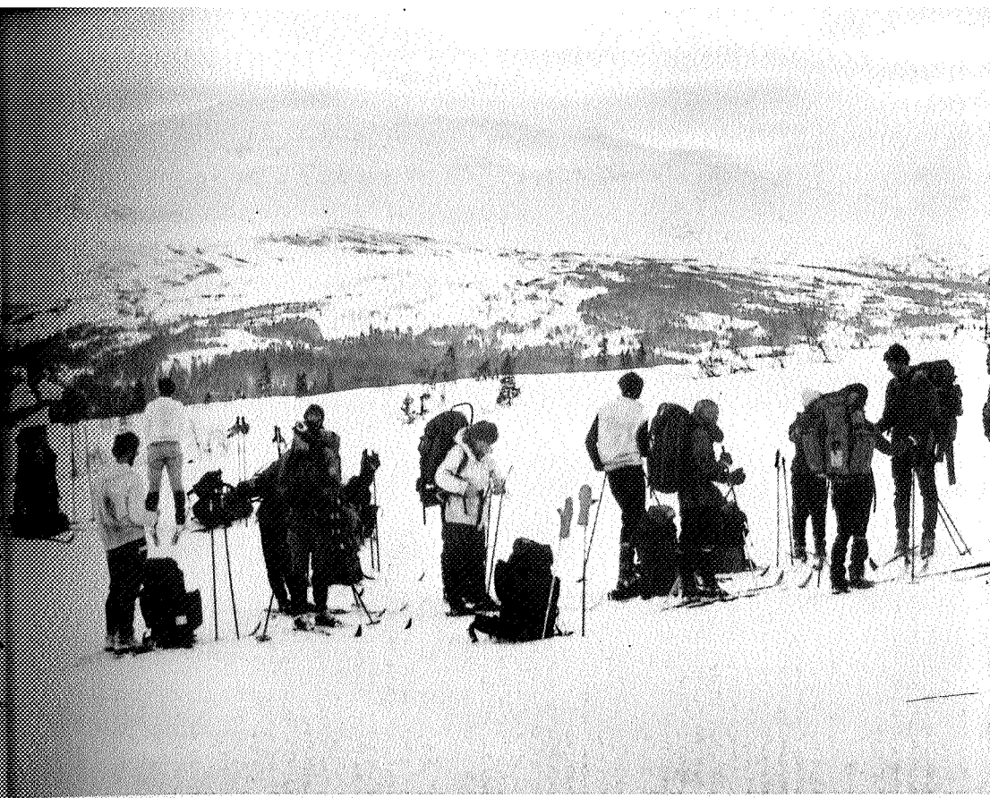
Roltdalen mot Fongen. (ERIK STABELL)

Sør-Trøndelag Naturvern og Trondhjems Turistforening vil takke alle bidragsytere til artikkelserien for bidrag til å belyse de ulike