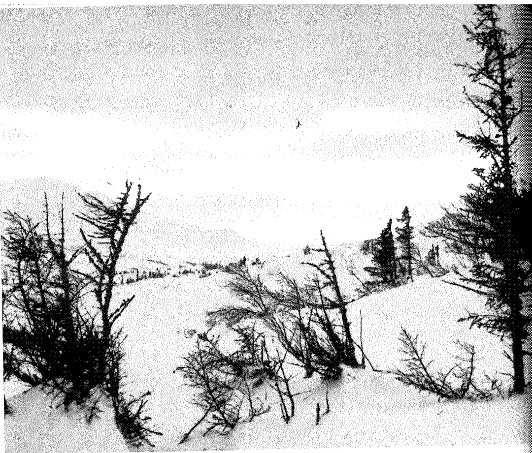
Roltdalen mot Melshogna..

betydning for friluftslivet både i bygdene og vurdert regionalt for Trøndelag.