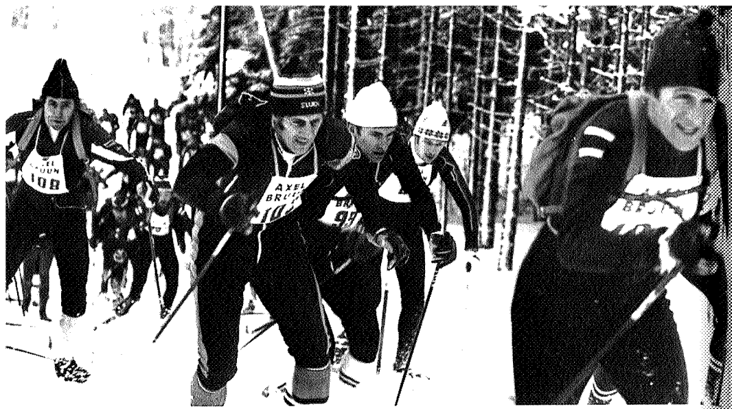
Bymarka idag: Deltagere i den årvisse Markatrimmen på innbitt ferd mot målet.

Så kan man spørre: Ville det ikke være naturlig at TSK og TT, som har så mange felles interesser og nesten identiske formålsparagrafer, innledet en eller annen form for samarbeid på det praktiske plan?