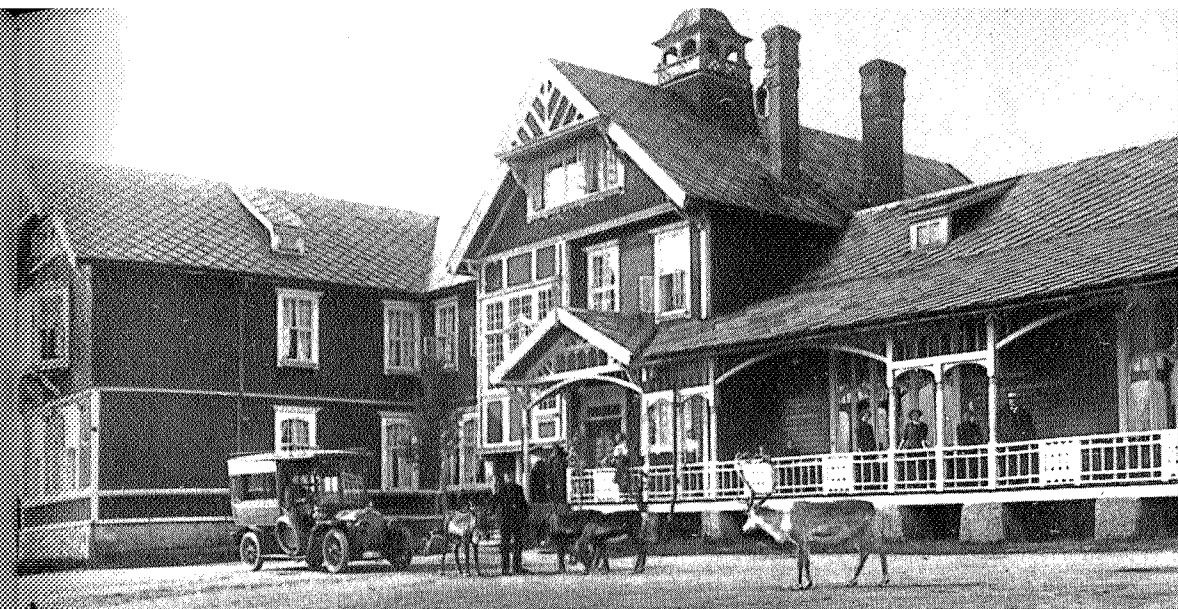
Fjeldsæter - med reinsdyr på tunet!

TSK har i dag ikke selv aktive utøvere innen vår edle nasjonalsport, slik tilfelle var tidligere. Men på arrangementssiden prøver skiklubben å føre gamle, gode tradisjoner videre. Normalt står Trondhjems Skiklub bak to store renn hver vinter, nemlig Gråkallen Skifestival (tidl. Det lille Gråkallrenn), som visstnok er verdens eldste barne- og ungdomsskirenn, og Markatrimmen, som arrangeres i samarbeid med Trondheim Bedriftsidrettsråd og er Trøndelags største turrenn hva deltakelse angår. Turrennet er 27 km langt og går gjennom noe av det fineste og mest avvekslende terreng Bymarka kan oppvise. Det er åpnet for bedriftsløpere og trimmere. Når dette skrives er påmeldingsfristen for årets stormønstring ennå ikke utløpt, men man regner med omkring 2000 startende. I Gråkallen Skifestival, som omfatter slalåm, storslalåm, langrenn, hopp og kombinert, inkl. diverse klasser for handicappede, var det siste vinter rundt 1000 startende. Vinterens renn er nr. 88 i rekken.