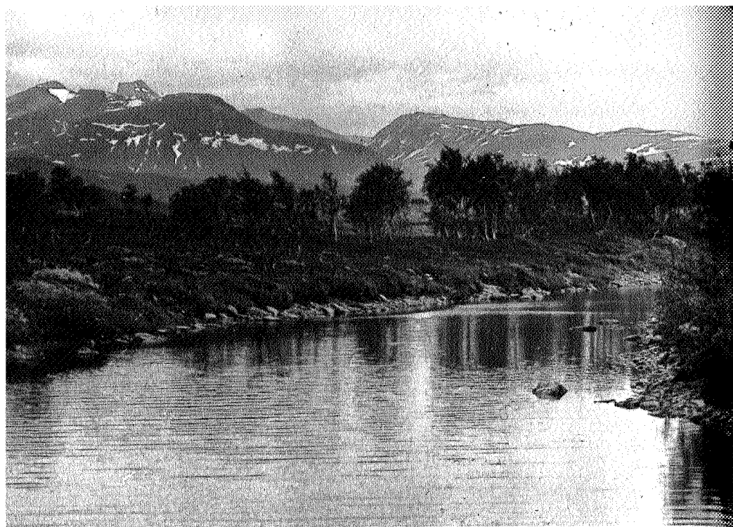
Dypholma og Sylene