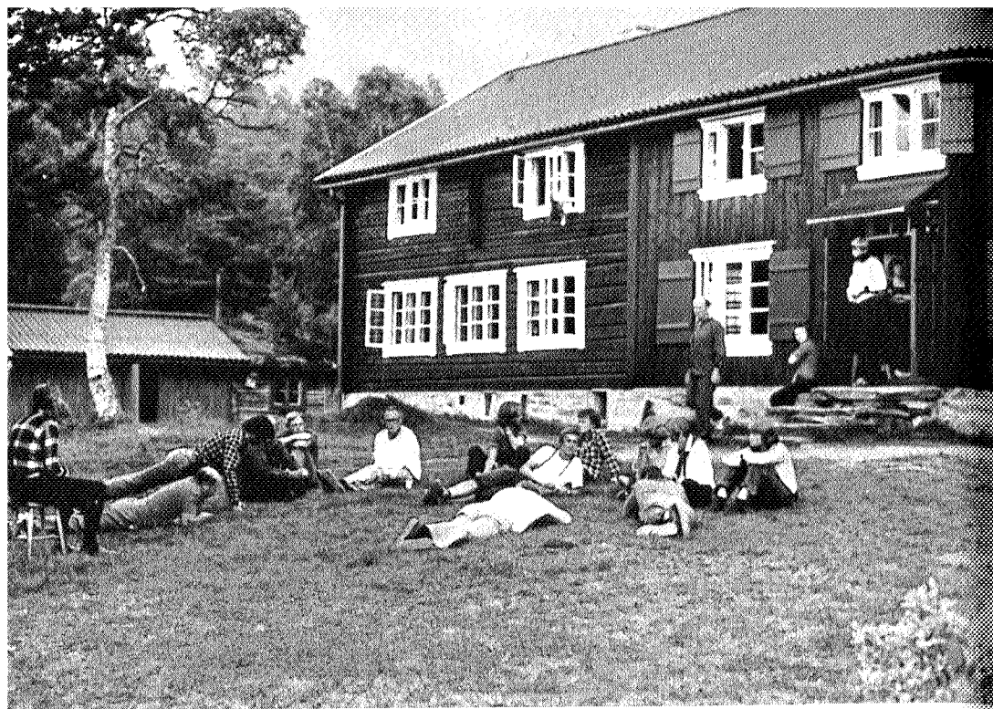
Avslappet stemning på grasbakken foran Trollheimshytta.