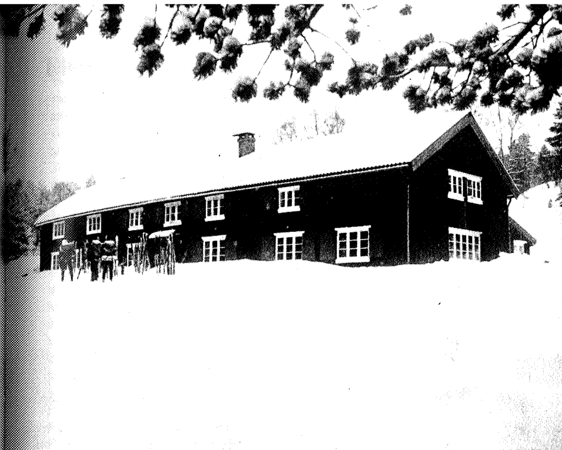
Trollheimshytta, påsken 1980

Fra Johan Falkbergets artikkel «Bergstaden — Trondhjem».