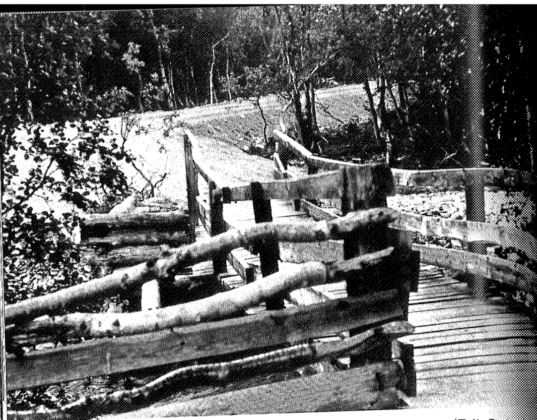
Gammelbrua over Gjördøla og nyvegen.