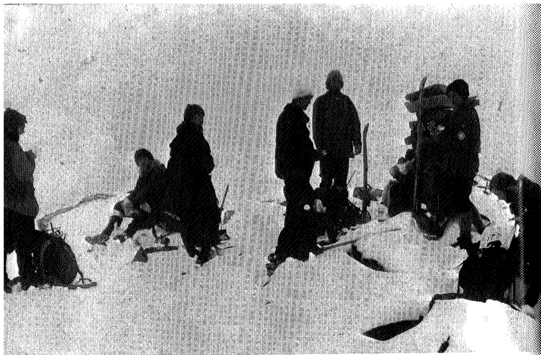
På toppen så vi hverandre, varden og et par ski