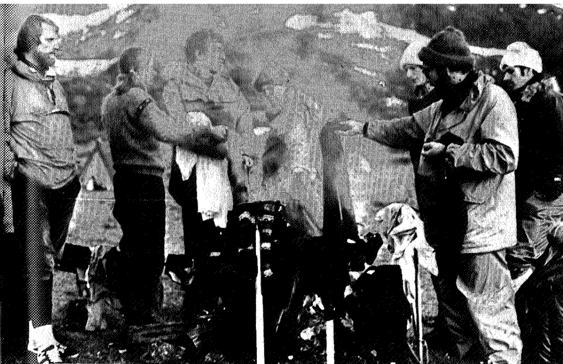
Lukt av svette erstattes med lukt av sur røyk.

De mange rastene underveis hadde tæret hardt på matpakkene, og med den steikende sola minket også vannbeholdninga raskt. Så da