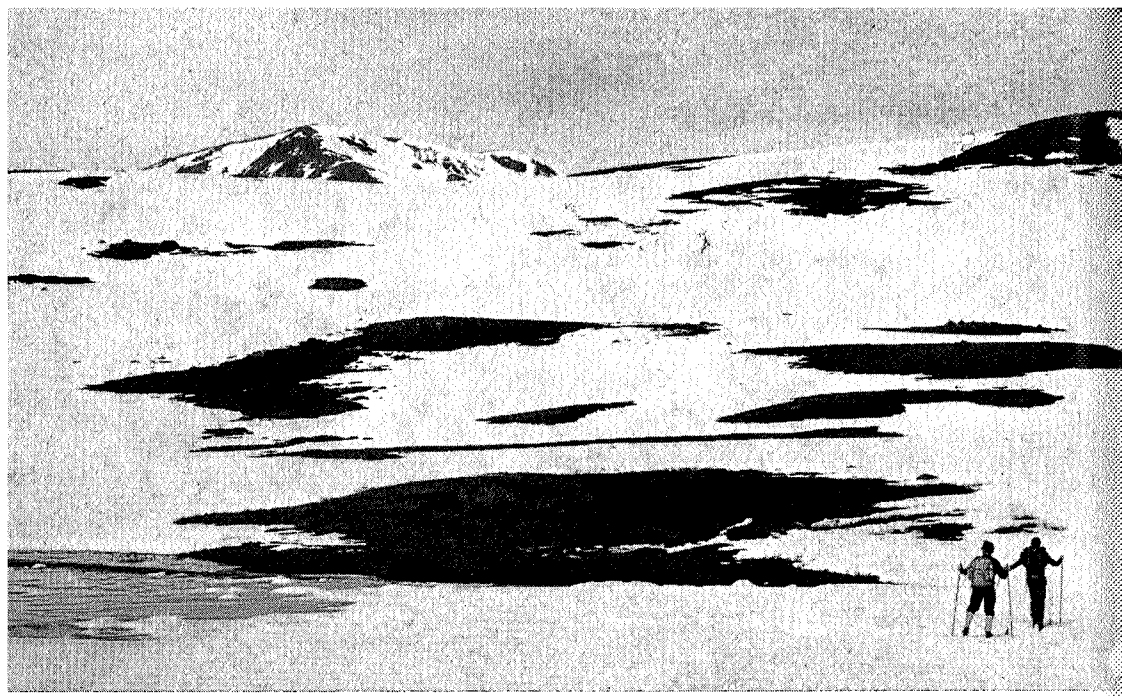
Det våres. Minilla mot Svarthetta