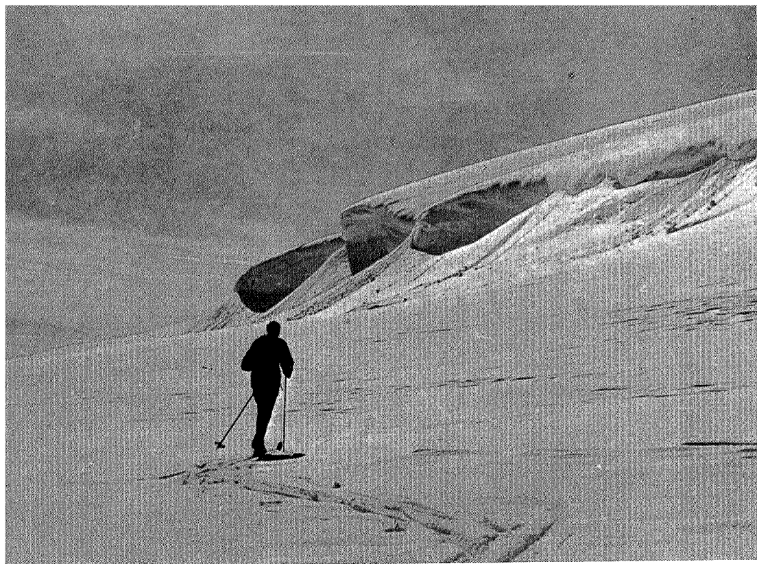
Botnhamrene i Aunegrenda