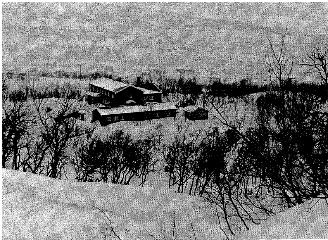
Nedalshytta i vinterdrakt.