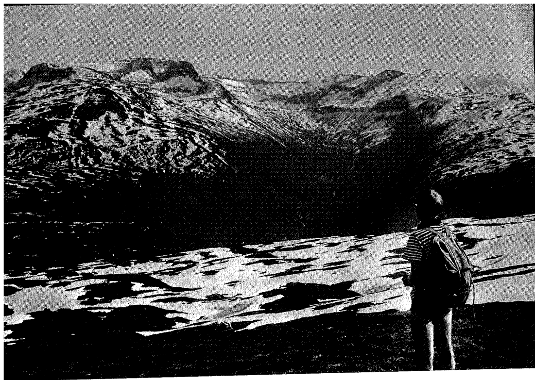
Utsikt sydover fra Honstadknyken mot Trollheimen. En ser inn i Søyådalen, med Blånebbå til venstre og Trollhetta midt i mot. Trolltoppene og Skarsfjell i Innerdalen kan også skimtes.