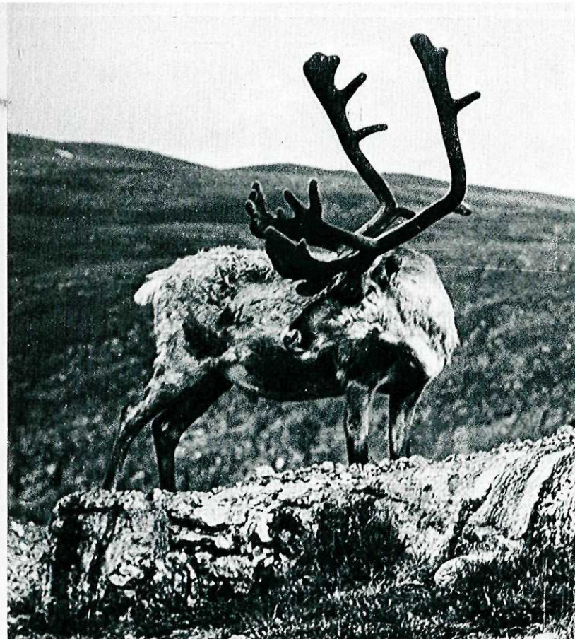
Kommer det noen bak?

Ta ikke bare ett bilde. Ett enkelt bilde kan være vakkert, som ren fotokunst eller det kan være et bilde som viser et øyeblikk fra en hendelse eller opplevelse. Men som oftest har man mest glede av familiefotografering hvis man tar en serie bilder som tilsammen forteller en historie. Fotografér fra forskjellige vinkler, og er man i tvil kan det tas en to-tre bilder med variert innstilling på kameraet.