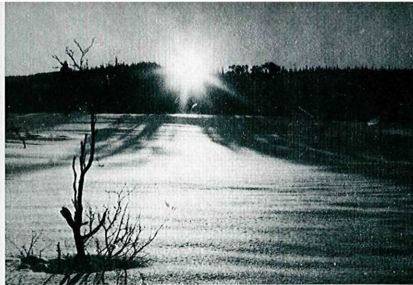
Vinterdag på Selbuskogen.

Størst muligheter har selvfølgelig dem som fotograferer med speilreflekskameraer. Når det gjelder lysforholdene for denne typen kameraer registrerer eksponeringsmåleren det lys som reflekteres fra motivet, gjerne de nærmeste omgivelser. Ved fotografering av landskap bør man rette kameraet ned mot bakken for å måle, ellers vil lyset fra himmelen få for stor innvirkning og bildet vil bli for mørkt (underekspontert). Særlig i overskyet vær er det viktig at