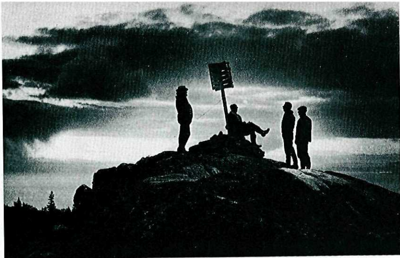
«Soloppgang på Geitfjellet i Bymarka» viser hva det går an å få til i motlys.