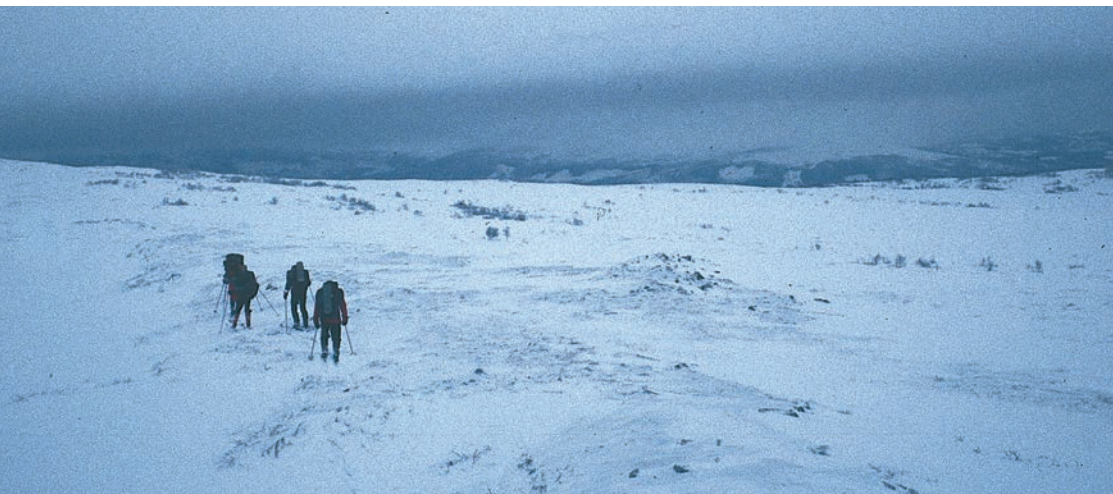
Øst om Litlbukkhammaren mot Græsli i Tydal.

Spelet var hovedinnslaget på turen, og alle satte pris på å få være til stede. Uten spelet hadde det kun blitt en skitur, nå ble det et historisk sus og spenning over turen slik jeg aldri før har opplevd.