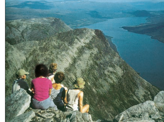
Indre Gjevilvasskammen.

Denne turen er den luftigste av forslagene i brosjyren, og en av de få mulighetene til eggvandring av noen lengde i denne delen av Trollheimen. I tillegg er utsynet fra toppen