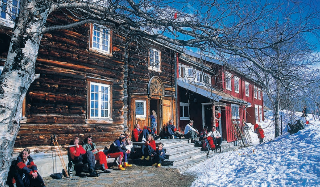
Gjevilvasshytta er ei populær og tradisjonsrik turisthytte.