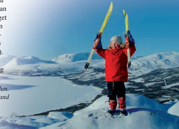
Vinterglede i vakre Gjevilvassdalen.

Mulighetene for vinterskiturer rundt Gjevilvasshytta er svært gode ikke minst på grunn av gode snøforhold. Gode turfjell som Storhornet, Okla, Midtre Gjevilvasskam og Blåhø er alle lett tilgjengelige. Både Storhornet og Blåhø er svært populære turmål på sen vinteren. Beskrivelser av ruter vil du finne mange av i litteraturlista (nr. 5, 8, 12, 13, og 14).