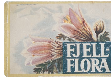
Originalutgaven av Fjellfloraen fra 1952.