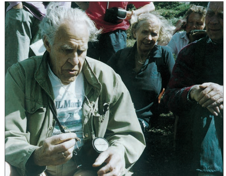
Olav Gjærevolls siste blomstertur for TT i 1993.