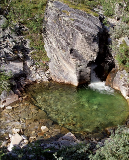
En av kulpene i Gjerdøla.

Raudøra er en lokalt meget berømt 2 km lang sandstrand nedenfor Gjevilvasshytta. Det er ca en kilometer å gå fra hytta. Langgrunne forhold gjør at det ikke trengs mange dagers