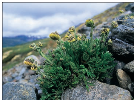
Norsk malurt.

En hver fjellvandrers på tur i Trollheimen bør minst en gang i livet bruke en hel dag bare til å rusle rundt på Tyrikvamfjell, i de sør- og vestvendte brattskråningene under Blåhø eller i rasmarene under Heimre Gjevilvasskammen vest for Kamtjønnin for å finne noen av våre mange sjeldne og flotte fjellplanter. Vi foreslår Tyrikvamfjell siden det er nærmest hytta. Følg stien mot Jøldalshytta og ta opp skråningen mot toppen når du kommer ut av skogen. Her kan du starte botaniseringen. Du kan gjøre en rundtur ved å avslutte med å gå ut den sørlige ryggen av Tyrikvamfjell rett ned mot Gjevilvasshytta til du møter stien straks før du kommer ned til einerbuskene rett før skoggrensa. Stien er tegnet inn på orienteringskartet.