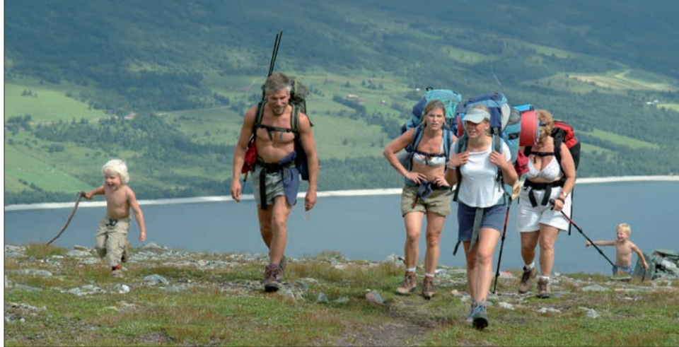
På vei opp mot Okla.