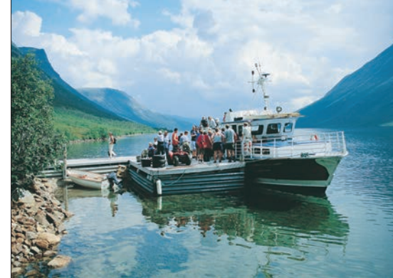
Trollheimen II ligger til kai ved Vassenden.

Båten «Trollheimen II» går i turistsesongen fra Osen (østenden av vatnet) via Raudøra nedenfor Gjevilvasshytta til Vassendsetra (vestenden av vatnet). Stien ned til Raudørkaia er godt