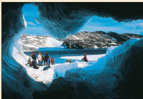
Blåsalen.