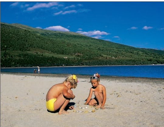
Raudøra, Gjevilvassdalens egen badestrand.

godvær til før temperaturen i vannet er overraskende behagelig. Gå utover langs stranda fram til fjellknausen hvor Gravbekken renner ut og du får en følelse av dimensjonene til denne karakteristiske lagune-aktige sandavsetningen. Herfra åpner det seg samtidig en flott utsikt inn langs vatnet og mot Gjevilvasskamman.