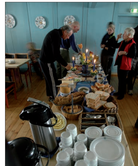
Frokost på Gjevilvasshytta.

Det finnes fisk (rør og/eller ørret) i de fleste fjellvatna i området. Fisken har vanskelige gyteforhold i noen av vatna på grunn av høyden, og det settes derfor ut yngel med ca fem års mellomrom. Gjevilvatnet er i dag et