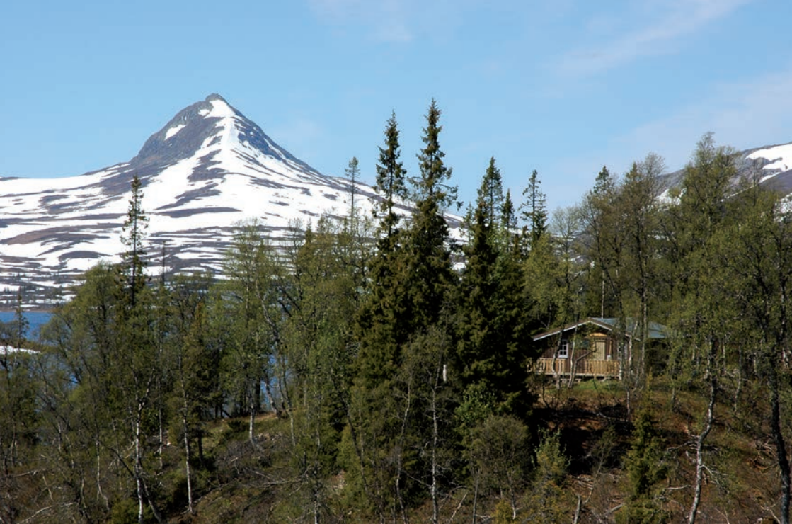
Lakavasshytta med Lakavasshatten i bakgrunnen.

bruks- og bosettingsområder der. Deler av to reinbeite-distrikt ligger i området og de har til sammen åtte driftsenheter.