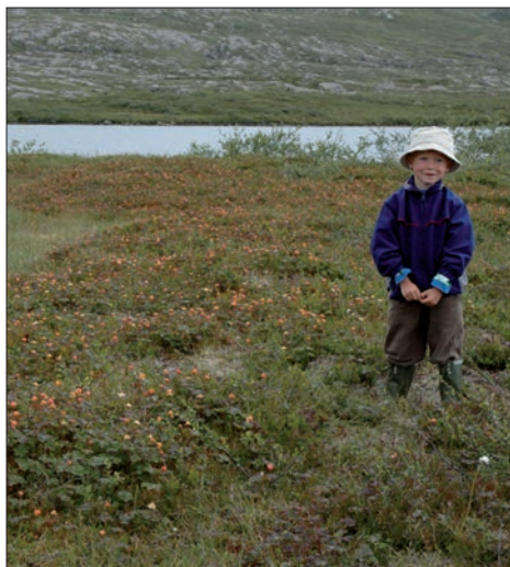
2005 var et bra molteår, til glede for både liten og stor.