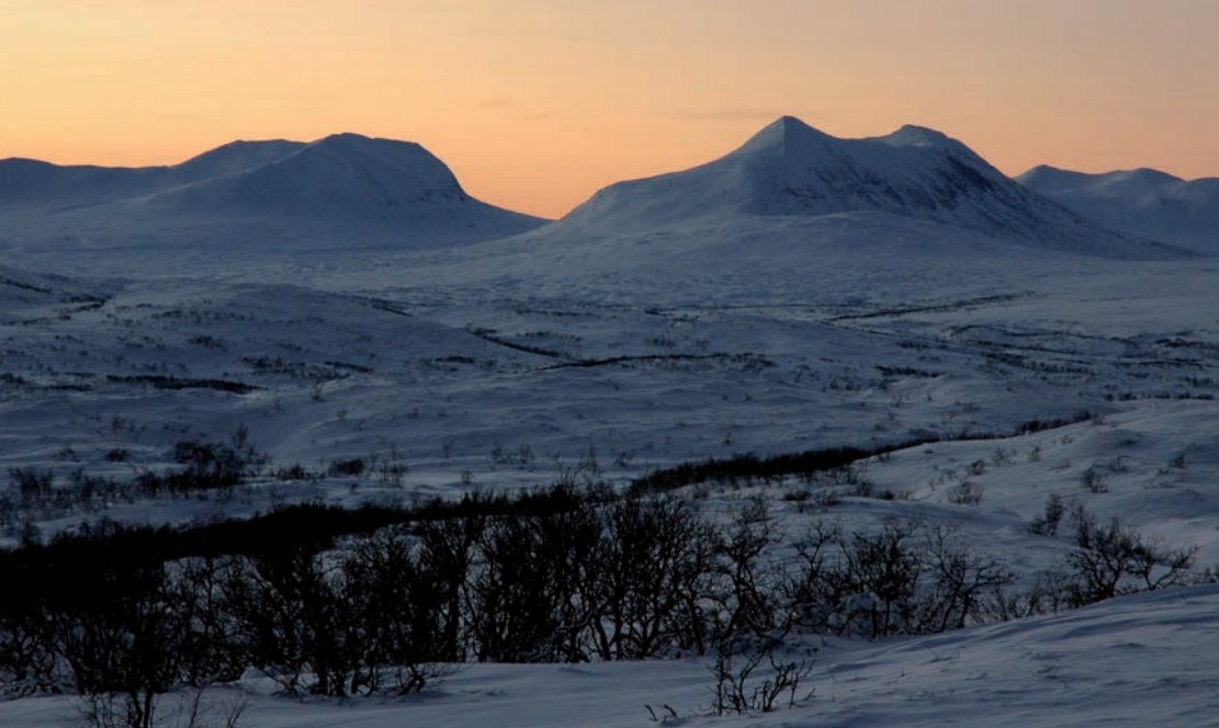
Blåfjella i vakkert januarlys.