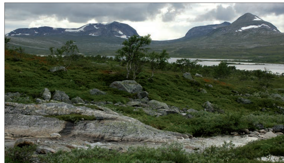
Mot Store Blåfjellvatnet, Aallejegæjsie og Midtliklumpen.

nasjonalparker med et større spekter av naturtyper og flere muligheter for naturopplevelser enn de fleste andre som bor i Norge. Nesten 1/3 av nasjonalparkene i Norge ligger helt eller delvis i våre to fylker. Og Casparis beskrivelsen av naturen i Lierne bør vel pirre nysgjerrigheten til noen hver, eller i alle fall de som har lyst til å oppleve også den delen av mangfoldet i vår trønderske natur!