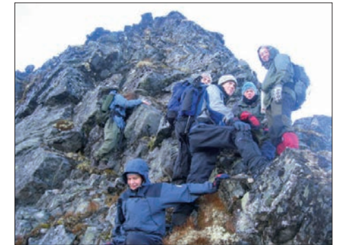
På vei ned fra Skjortehornet.

oppover den storsteinete ura i dalsiden mot Skjortehornet. Lunsjen nytes oppe i høyden med nydelig utsikt over Sunnmøres fjorder og fjell. Til alles store skuffelse kommer vi ikke helt opp på Skjortehornet, det er for bratt, og derfor uforsvarlig. Likevel var det en praktfull dag oppe i høyden.