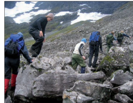
Klyving oppover ura på vestsiden av Velle-sætrédalen.

Nedenfor Brekkeitindene ligger Gullmorbreen, ut fra den renner ei regnfull elv som må krysses. Vi leter litt etter et sted for å krysse, og med hjelp fra hverandre kommer vi oss velberget over, ikke blautere enn vi var. Vi orienterer oss gjennom tåka og nærmer oss det høyeste punktet på dagsetappen og de etterlengtede og fryktede nedoverbakkene mot