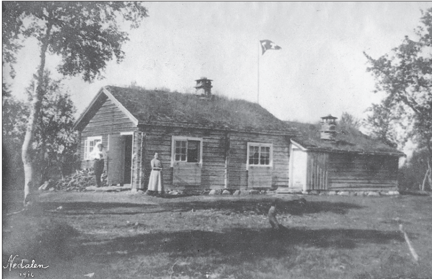
Den andre Nedalshytta ble bygget i 1903 og så slik ut i 1916 (se også side 37).