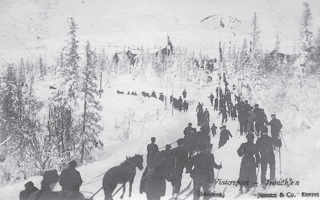
Øvre del av Fjellseterveien med Skistua en skisøndag på begynnelsen av 1900-tallet. Prospektkort utlånt av Erik Stabell