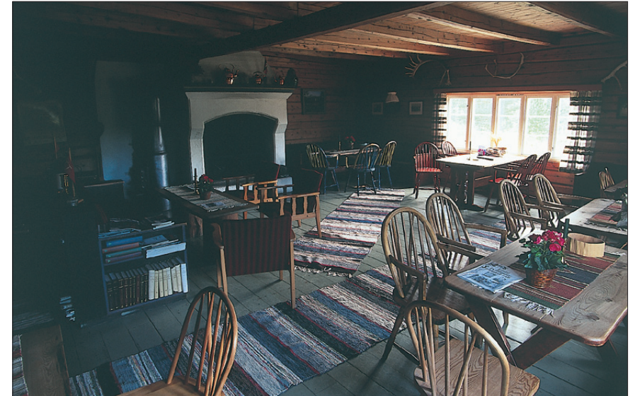
Nyere bilde fra peisestua på Trollheimshytta.