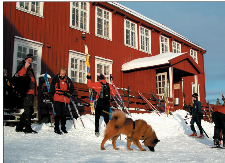
Rønningen er et populært serveringssted og dagsturmål for Trondheims befolkning.

Rønningen heter egentlig Leirås – et navn gården har fått etter den vel 300 meter høye åsen som den ligger i sørhellingen av. Når og hvorfor