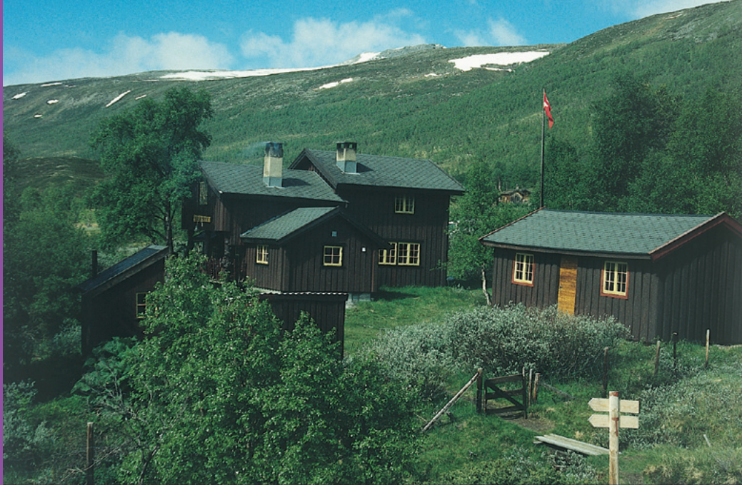
Dindalshytta slik den ser ut i dag.

vinteren. Innvendig ble det også gjort mindre endringer på kjøkkenet og i tillegg noen andre som bl.a. økte overnattingskapasiteten til 11 senger pluss to sengebenger og flatsengmuligheter både på loftet og i peisestua.