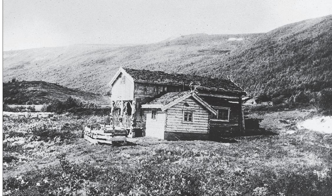
Dindalshytta har sin høyst særegne historie.