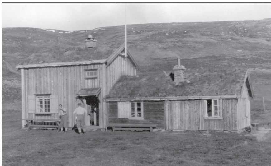
Ved restaureringen av Orkelsjøhytta på 1980-tallet ble kjøkkenet med et betjeningssoverom til høyre på bildet revet og selvbetjeningsrom innredet i tommerdelen.

Da byggingen av Dovrebanen var fullført, hadde Den Norske Turistforening av NSB fått to brakker som ble brukt under anlegget av banen gjennom i Drivdalen. DNT hadde hatt planer om muligens å bruke brakkene til hytta i Setaldalen, men etter at denne hytteplanen ble oppgitt eller lagt på is, visste ikke DNT helt hva brakkene skulle brukes til. TT