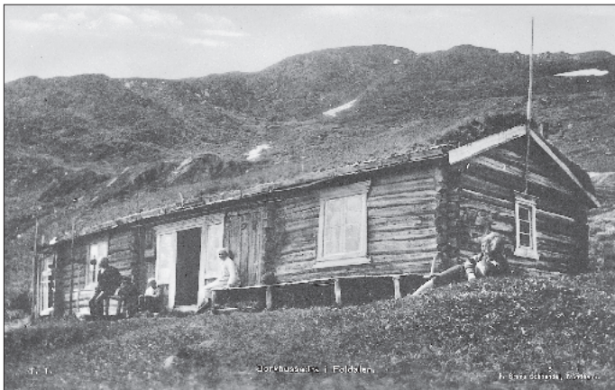
Borkhussetra i Foldalen. Prospektkort fra F. Bruns Bokhandel