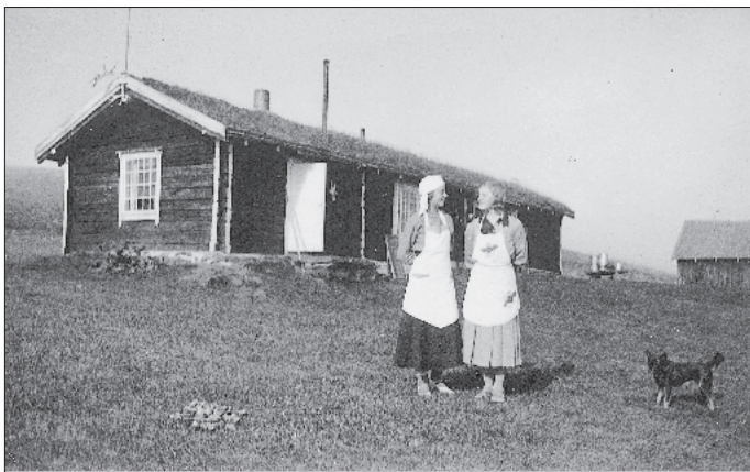
Turistforeningens stasjon ved Fjell- lægret.