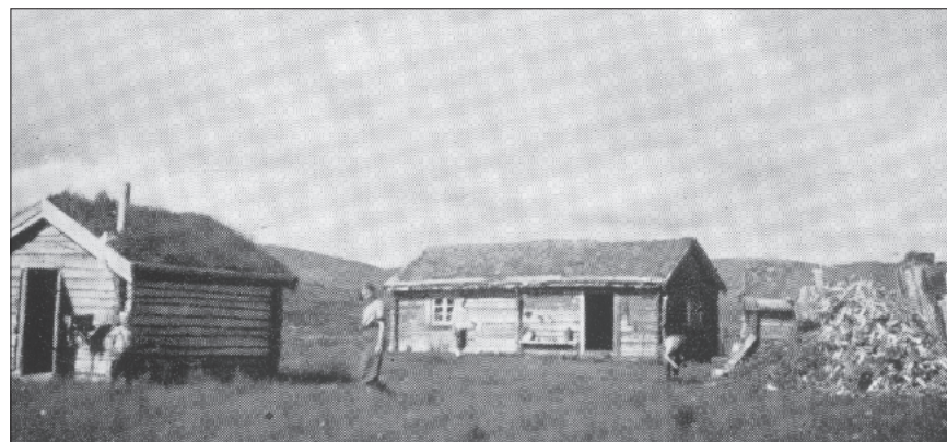
I 1923 hadde TT store planer ved Aalbusetra ved Orkelsjøen.

turistkvarter på setrene sine i Setaldalen (eller "Saatteldalen, som det står i TTs årsberetninger). Tilsammen var det omlag 15 senger på de to setrene og eierne forkynte planer om ytterligere utbygging.