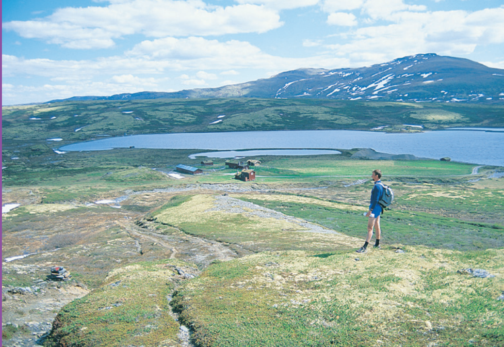
Orkelsjøhytta ligger fritt til ved Orkelsjøen.