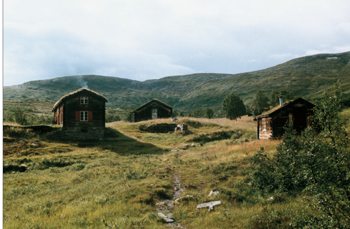
I 2001 inngikk TT avtale på Vestre Vassendseter.