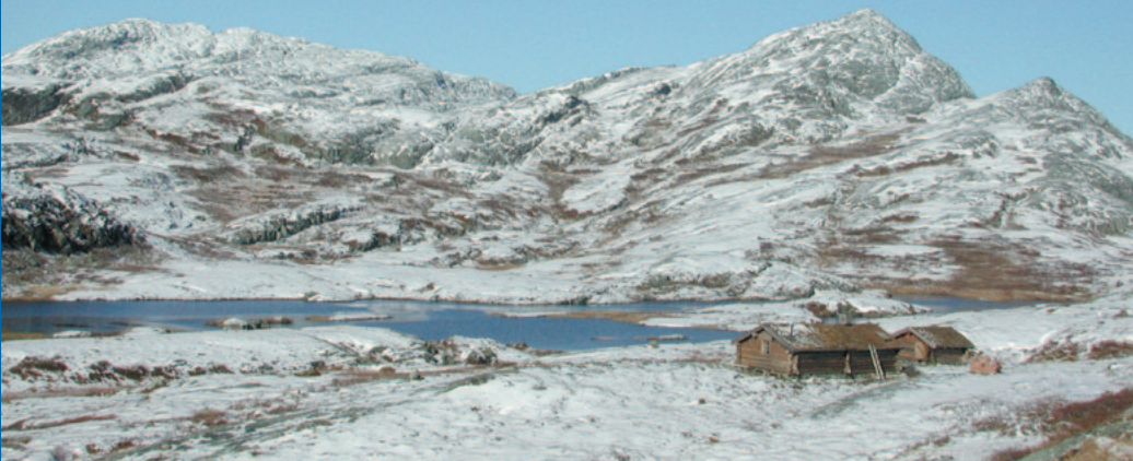
I Barnas Naturverden er det tre selehus. Her fra Heverfallsetra.