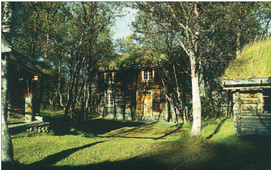
Hytta i midten er TTs kvarter på Viongen.

sengetall selvsagt ikke på noen måte erstatte de store hyttene i Trollheimen, men gården var tross alt et tilbud for dem som absolutt ville til fjells. Kvarteret hadde i løpet av sommeren 1943 91 overnattinger, men besøkstall for resten av krigen er ikke oppgitt i årsberetningene. Vi må vel likevel anta at Vollslettet ble godt besøkt, ettersom flere av de andre kvarterne også ble nødt til å stenge, slik at TT i siste halvdel av krigen bare hadde Orkelsjøhytta samt kvarterene på Borkhusseter, Fjellægret, Dindalshytta og Kårvatn å by på i tillegg til Vollslettet.