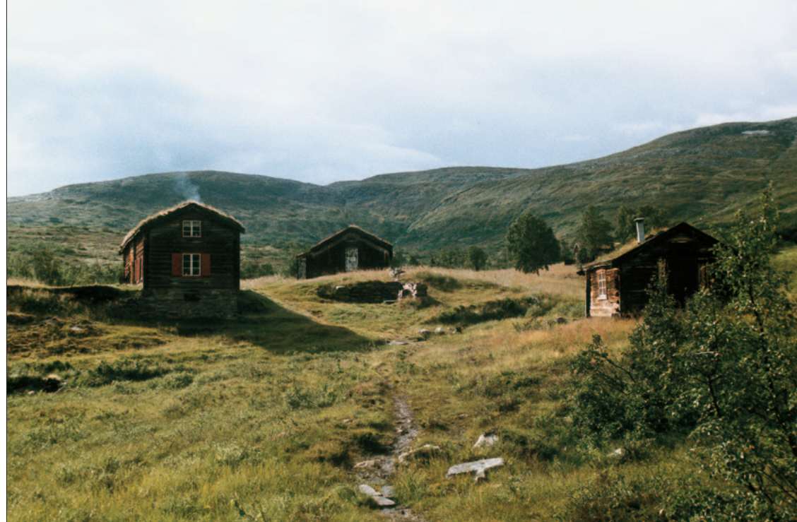
I 2001 inngikk TT avtale på Vestre Vassendseter.