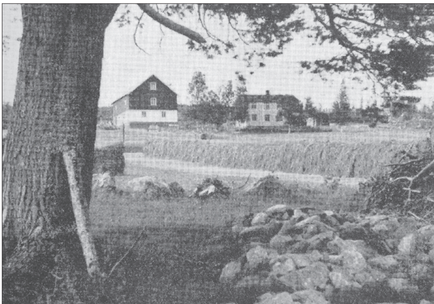
I 1942 inngikk TT en kvarteravtale med Vollslettet på Nerskogen.

Vollslettet var en kjærkommen tilvekst i en vanskelig tid, der mulighetene for bruk av TT-hyttene var sterkt innskrenket på grunn av grensestriksjonene i Sylene. Og verre skulle det bli da også hyttene i Trollheimen ble beslaglagt i 1943. Vollslettet kunne med sitt beskjedne