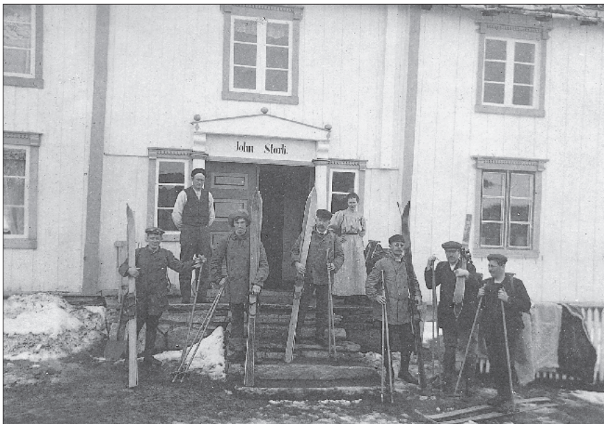
Skiløpere på Storli på slutten av 1800-tallet.