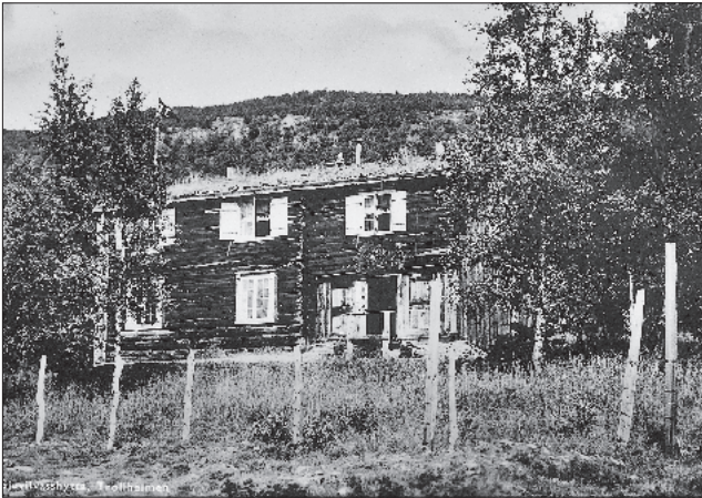
Gjevilvasshytta i 1922.

utskiftes, var alt materiale i den allerbedste forfatning og stuen kunne opføres slik at dens oprindelige vakre utseende blev bevart," heter det i årsberetningen for 1922. Hele annen etasje ble oppdelt i seks mindre soverom med tilsammen 22 senger. Første etasje fikk beholde sitt opprinnelige utseende, men for å skaffe hytta en spisestue ble etter tegning av arkitekt Grendahl på baksiden reist et tilbygg "i Opdalsstil", hvor det også ble plass til to mindre soverom. Kostnaden for det hele, medregnet kr. 7534,06 til inventar, var kr. 35861,81. Av dette hadde TT mottatt en støtte på kr. 5000 fra Norges Statsbaner og gjennom Den Norske Turistforening kr. 1500 av statsbidraget til turisme.