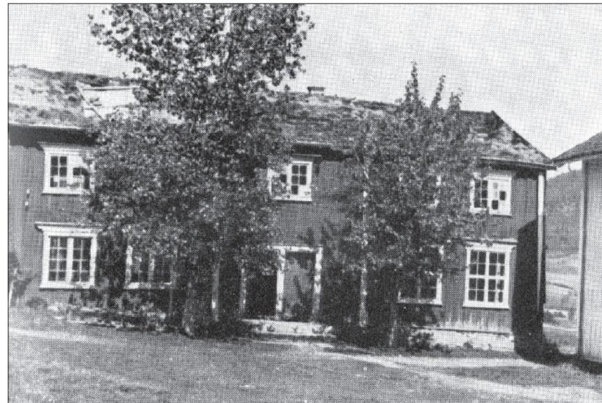
Tingstua på Syrstad i Meldal før den ble flyttet til Gjevilvasshytta.