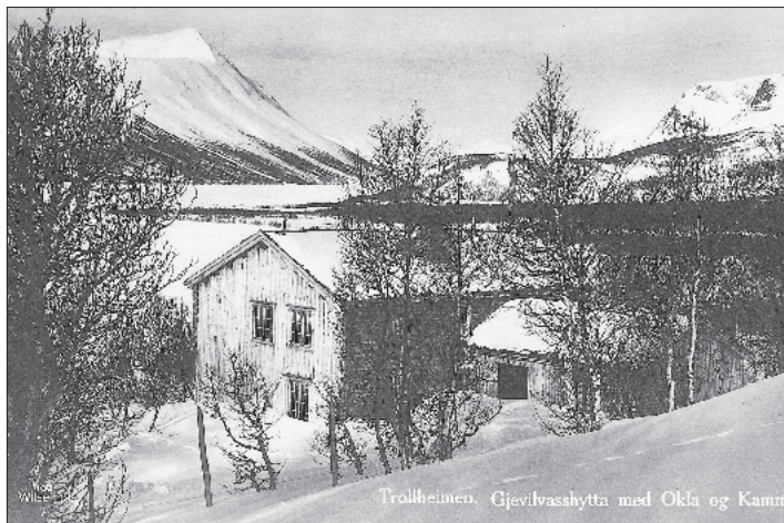
Gjevilvasshytta med tilbygget på baksiden, hvor det var spisestue og to små soverom.

Denne samme høsten (1922) kjøpte foreningen en tilgrensende seterløkke på omlag 55 mål for kr. 3000. TTs eiendom ved Gjevilvatnet ble med dette på 65 mål og hadde skog nok til å dekke hyttas behov for ved såvel i påsken som om sommeren. Eiendommen hadde dessuten godt beite for to-tre kyr som kunne skaffe hytta melk, og som vertinnen kunne stelle. På den innkjøpte seterløkken sto en mindre seterbygning, som uten altfor store utlegg lett kunne omgjøres til et hyggelig anneks med fire senger, og en høyløe som kunne brukes til vedbod og smørebu for påskens skiløpere.