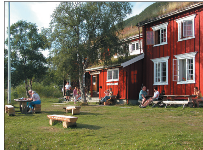
Gjevilvasshytta har et trivelig tun.

trukket inn i hytta ved at gjestene nå fikk et egnet sted å ta av seg fjellstøvler og skisko. Over kjellernedgangen på sørsiden ble det bygget et overbygg, som i likhet med vindfanget og uthuset var nøye tilpasset hyttas arkitektur. Derne ble dreneringen rundt en stor del av hytta fornyet og en rekke større og mindre ombygginger og utbedringer ble gjennomført både inne i hytta og utvendig. Det mest omfattende av disse arbeidene var en ny ombygging av kjøkkenet. Ikke minst viktig var dessuten at hytta, i samsvar med nye krav, fikk et automatisk brannvarslingsanlegg. Til slutt ble hele hytta malt utvendig. Regningen lød, omtrent som budsjettert, på kr. 1.063.434.