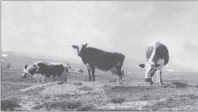
"De tre gratier"