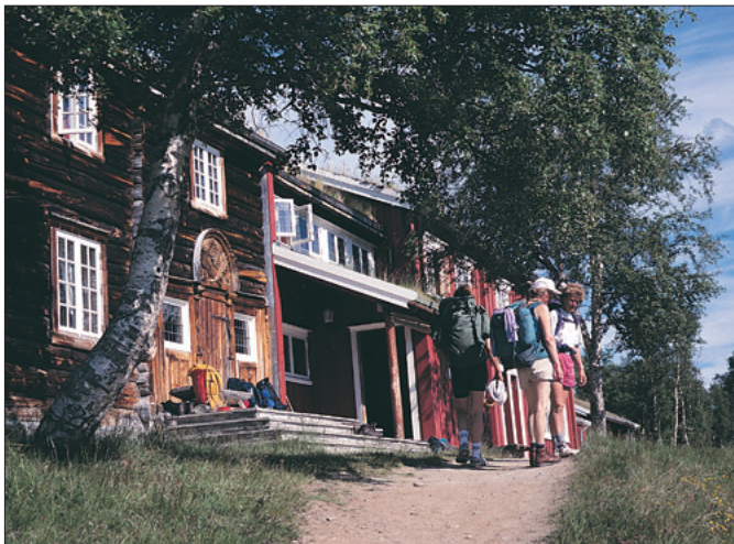
Gjevilvasshytta er en av de populære hyttene på turklassikeren "Trekanten" i Trollheimen