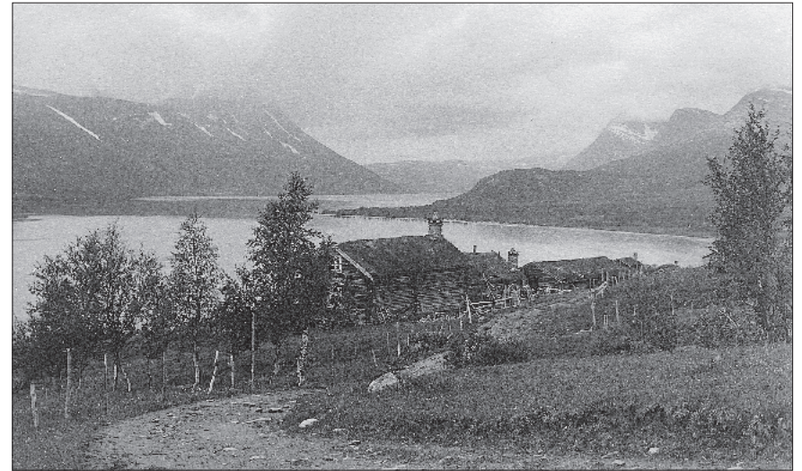
Behovet for en TT-hytte i Gjevilvassdalen ble akutt i 1919 da setereierne sa opp kvarteravtalene med foreningen.

"Griseutlodningen til indtægt for Gjevilvasshytten holdtes i uken 21. – 28. november 1920. Tiltrods for stor konkurranse med lignende utlodninger fik man et nettooverskudd av kr. 2996,03. Dette smukke resultat skyldes ikke mindst de mange assisterende dame-medlemmer, som herved bringes foreningens bedste tak." (Fra årsberetningen for 1920)