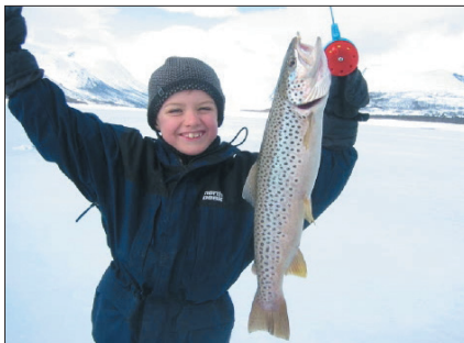
Det er populært med isfiske på Gjevilvatnet. Her en lykkelig storfisker med en ørret på 1,1 kilo.

Etter at også Gjevilvasshytta hadde fått et selvhushold for bruk utenom sesongene i uthuset, var spørsmålet hva som skulle skje med "Villa Tipp". Hytta hadde som følge av manglende vedlikehold dessverre forfalt og fremsto da Gjevilvasshytta var ferdig restaurert som en sørgelig kontrast. Et alternativ var selvsagt å fjerne bygningen, men "Tippen" kunne på den annen side bli et verdifullt supplement til selvhusholdet og ville ved å beholdes bidra til å skape en tunefekt på Gjevilvasshytta.