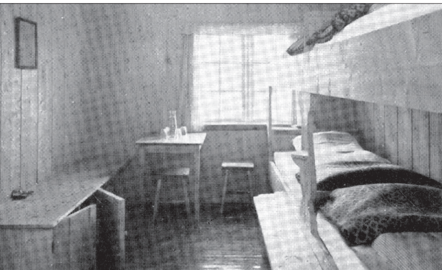
Soverom på Gjevilvasshytta.

På samme tid hadde foreningen også problemer med hyttas lysaggregat, som viste seg å være av den lunefulle sorten. Det var til stadighet kluss med det og i 1962 brøt motoren helt sammen, slik at en større reparasjon ble nødvendig. Det samme gjentok seg i 1964, så noen sikker energikilde var dette ikke. Foreningen håpet derfor på at det snart ville bli mulig å få fremført strøm til hytta, men forhandlinger om dette kom først i gang i