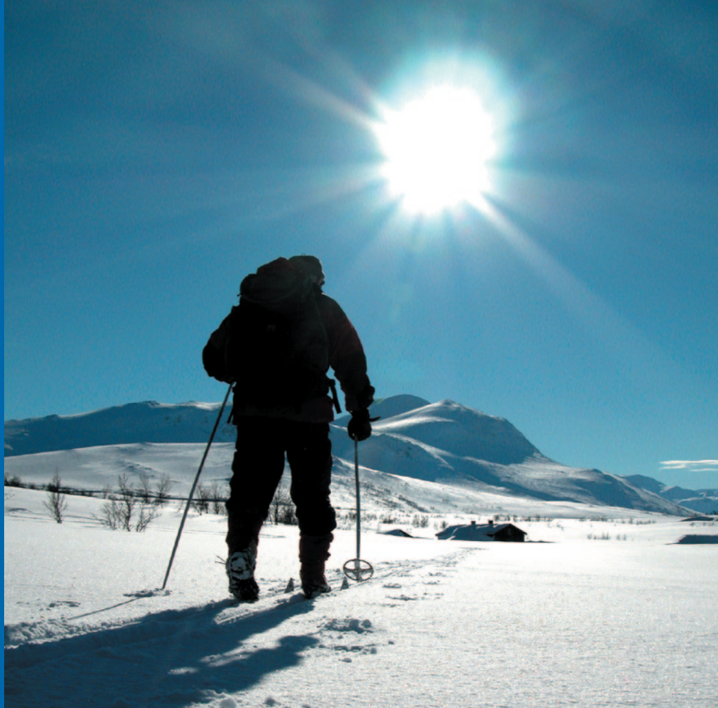
Ut fra Jøldalshytta med Svarthetta i bakgrunnen.