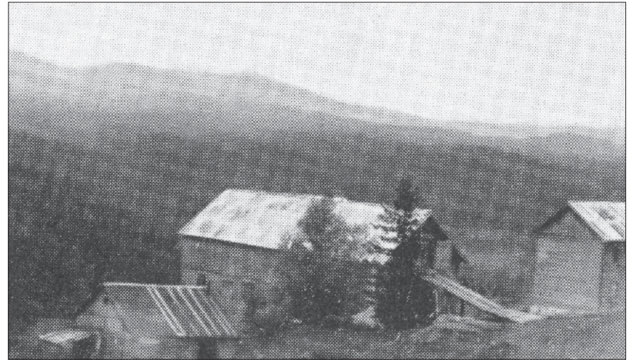
Sunndalen Gård i Sondalen.

På Sunndalen kunne de to konstatere at det fantes et rommelig losji på