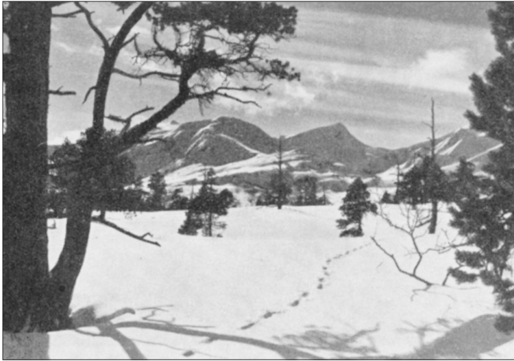
Mot Nedalssnota.

var godt. Hadde vi fått ei skikkelig snøskur da vi ikke visste akkurat hvor vi var, så hadde vi nok fått større problemer.