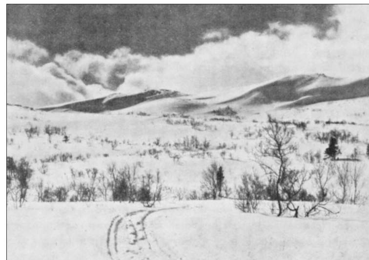
Mellom Rindal og Trollheimshytta.

Etter at de hadde forlatt hytta, var de snart framme ved Storli gard. Et navneskilt på gardsbygningen fortalte hvor de var. Egentlig hadde de tenkt å spørre om veggen videre over Trollheimen, men det var ikke tegn til liv å se på garden. Klokka hadde så vidt passert seks om morgenen 30. april. Etter litt rådslagning fortsatte de, for å komme fram til Folldalen og kjente trakter. Planene var greie, å gå opp fra Storli gard og inn i Hyttedalen og videre ned i Folldalen. Etter kvart skulle det vise seg at det ikke var så greit å gå i ukjent terreng – uten kart og kompass.