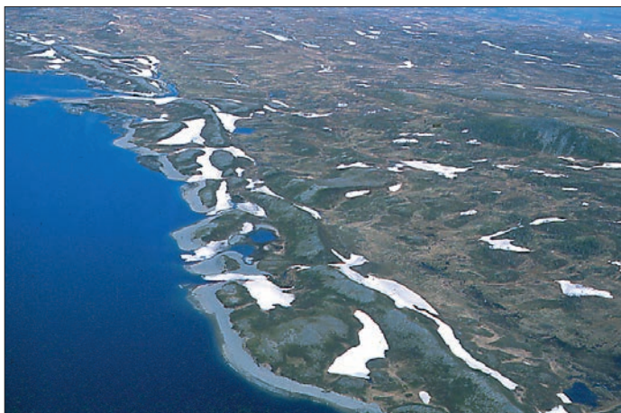
Utsnitt av den ca. 8 km lange eskeren ved Finnkoisjøen. Vann som avsatte denne eskeren rant ned i Roldalen. Bildet er tatt mot nordvest.

På tilbaketuren følger vi TT-stien forbi samenes sommerboplass [Ty237] og videre nedover til vi kommer til Skarpdalen. Før vi kommer til Skarpdalen går vi over ei stor flat slette som ligger på østsiden av veien mellom høydene 729 og 837 m o.h. Denne sletta er