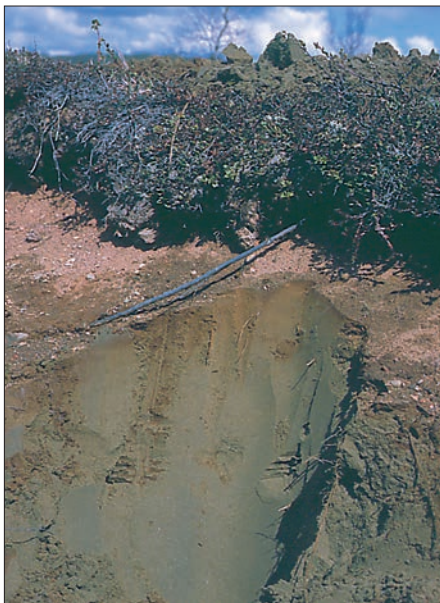
Bresjøavsetningen nord i Skarpdalen består av finsand.

fra Gilså gruver krysset elva. Malmen ble fraktet langs vestsida av Lødølja ned til Aune i Tydal. På nordøstsiden av veien følger den gamle transportveien samme trasé som TT-stien til Bjørneggen.