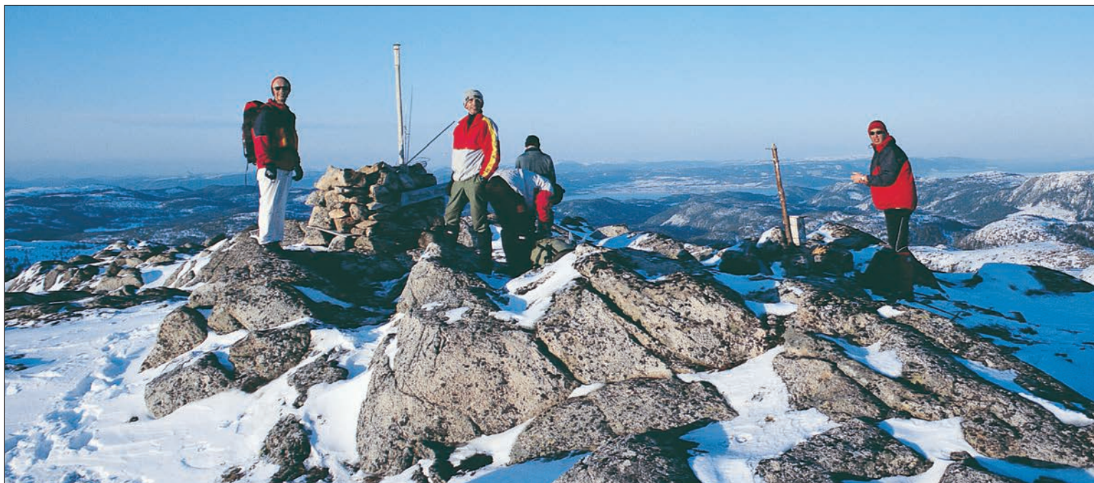
På Vargheia, 611 m, siste og høyeste topp på turen.

Vi får en ny flott utforkjøring framover til Fjelltjøna. At det i en mildværsperiode har gått et digert snøras i ett av brattsøkkene, vitner om at også slike lavfjellsområder kan være rasfarlige. Vi møtte tett og vanskelig granskog et stykke nede i den bratte lia mot gården Bakken. På neste tur velger vi nok å ta et slakere nedrenn sørøstover fra tjønna mot gården Kvernmo, lenger vest i dalen. Der er skogen åpnere.