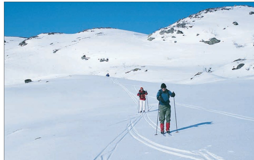
Flotte utforkjøringer framover fra Remmafjellet.

Det er tid for ny kort-rast før vi tar over dalen innfor Furutjørna og krongler oss sør for Storfjellet, over øvre Merratjørna og opp på turens høyeste punkt, Vargheia, 611 m. Vi synes det har gått lett og raskt hele vegen. Det har vært lette forhold. Vi var å gårde fra Åstfjorden allerede kl. 10.00. Likevel er klokka godt over fem og dalene under oss ligger allerede i skyggen.