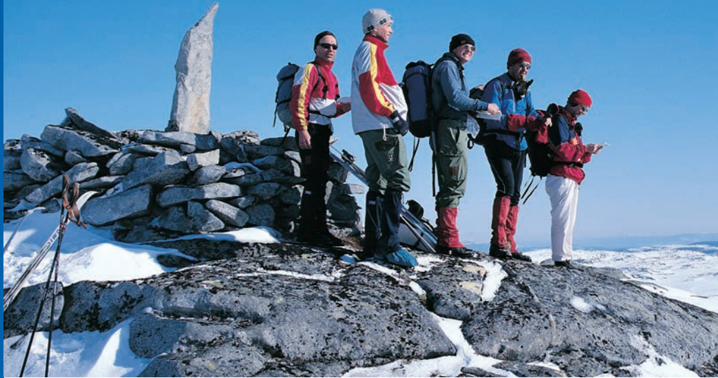
Høgt oppe på Remmafjellet. Bergsvarden, 571 m.